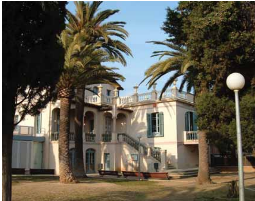
Can Maristany, seu de l'Escola de Música de Premià de Mar

25 anys, l'Escola de Música el 31 de març amb un concert i finalitzaran el proper 6 ha programat un seguit a càrrec dels professors al d'abril, amb el concert "Un d'activitats que van començar Patronat Social Premianenc món de guitarres".