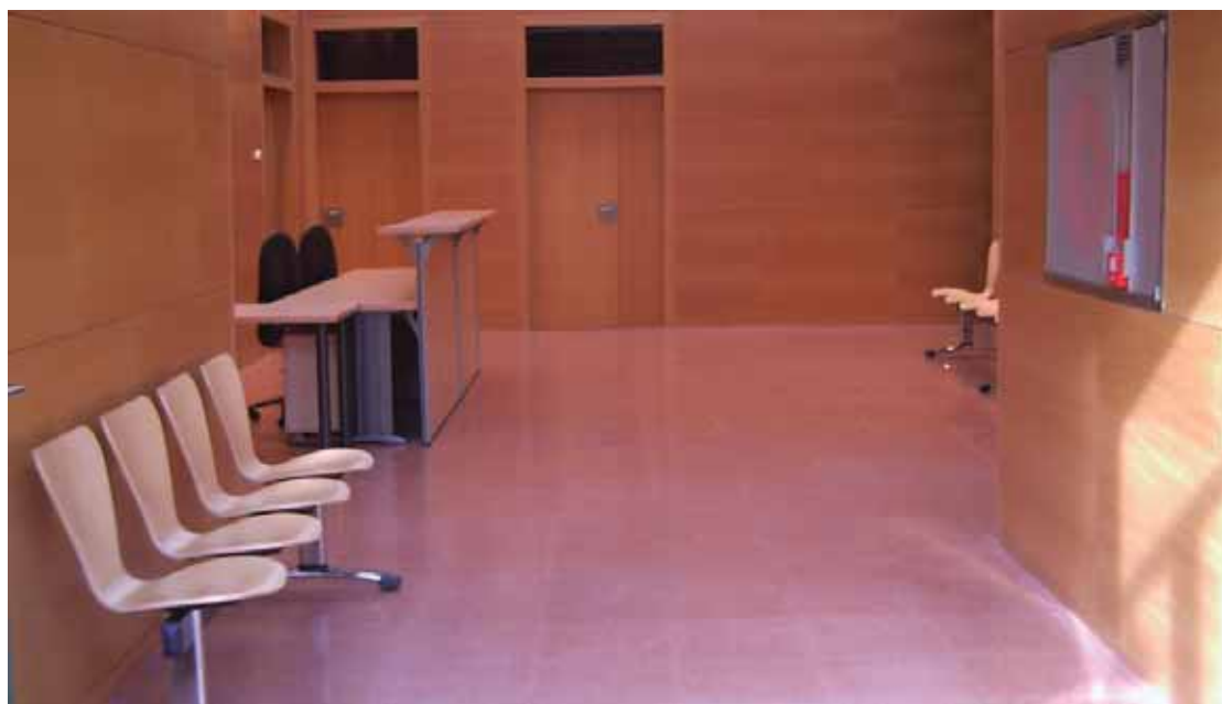
Els emprenedors que s'instal·lin al gas disposaran de serveis comuns per millorar la gestió del seu projecte

Els mateixos serveis estaran també a disposició dels treballadors autònoms i microempreses de nova creació que ho necessitin. D'altra banda, el nou espai remodelat disposarà de sales d'ús comú dotades amb