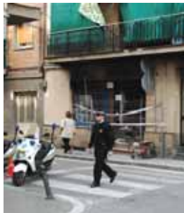
Immoble afectat al carrer del Pilar

El passat 20 de març a les vuit del vespre va tenir lloc una explosió a un local del carrer del Pilar causada per una bombona de gas butà. Com a conseqüència, hi va haver sis ferits, dos dels quals encara estan hospitalitzats i tots els veïns de l'immoble, una seixantena en total, van haver de ser desallotjats.