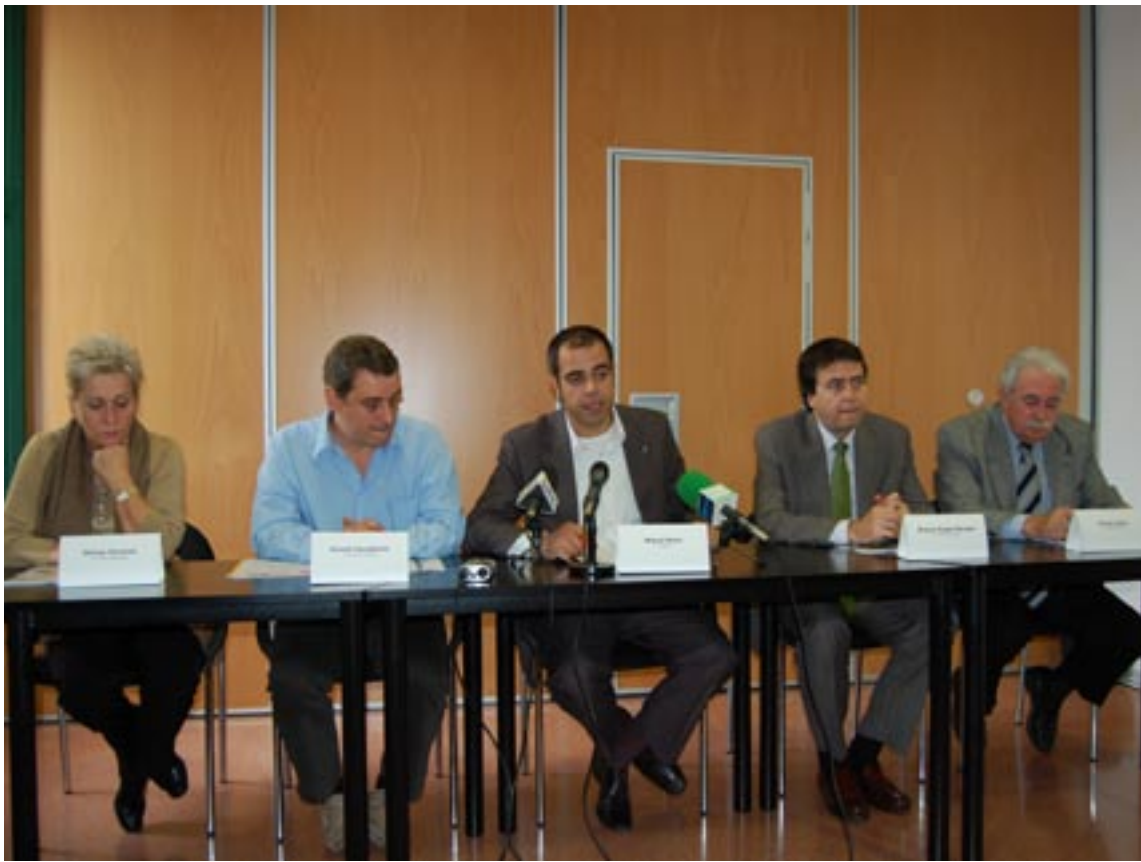
L'alcald i els quatre tinents d'alcald, a la roda de premsa de presentació del Pla d'Actuació Municipal

emprenedors, etc., sense oblidar la importància del desenvolupament cultural de la vila.