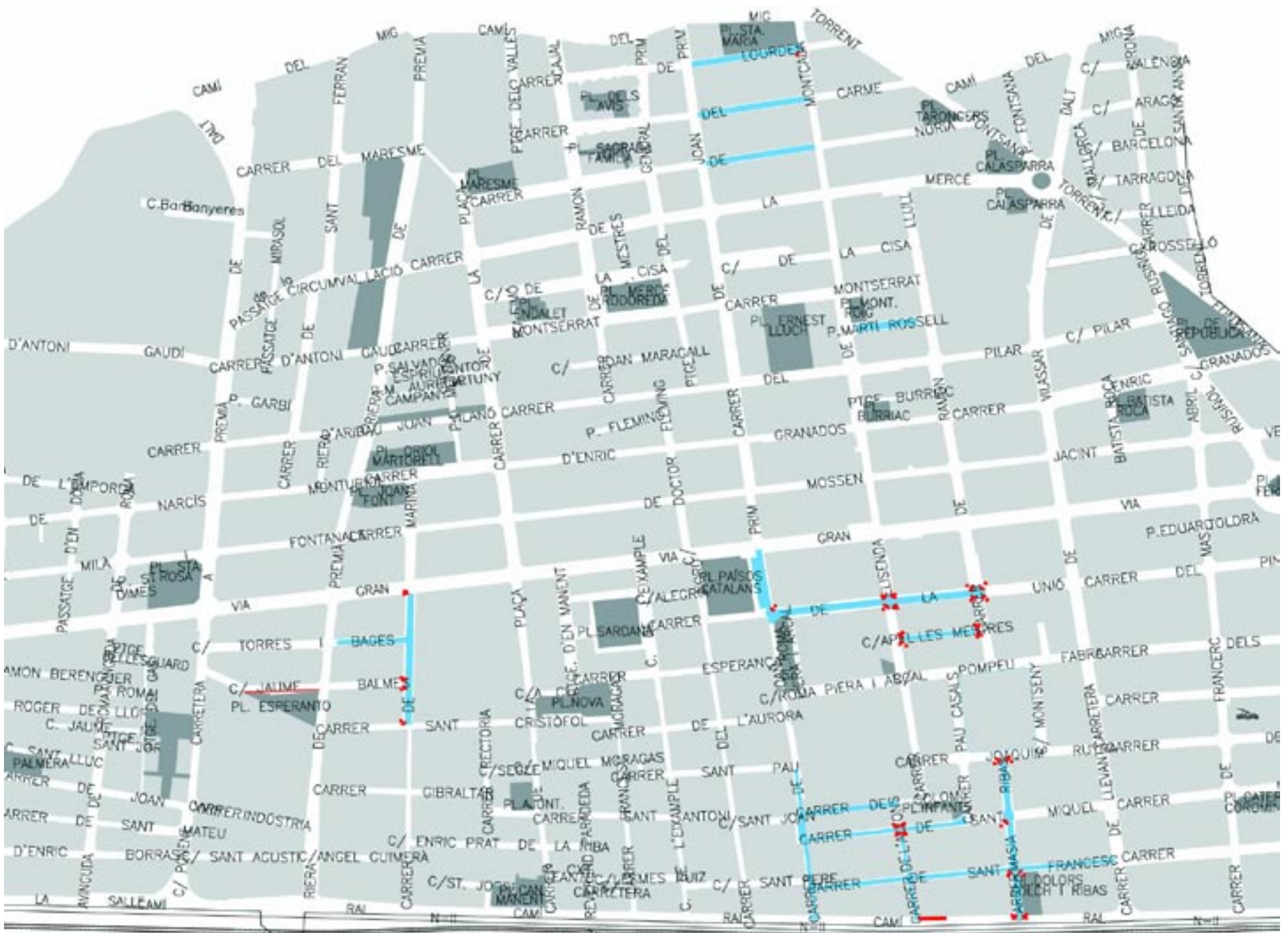
Marcats amb color blau i vermell, carrers, voreres i cantonades inclosos a la segona fase de pavimentació