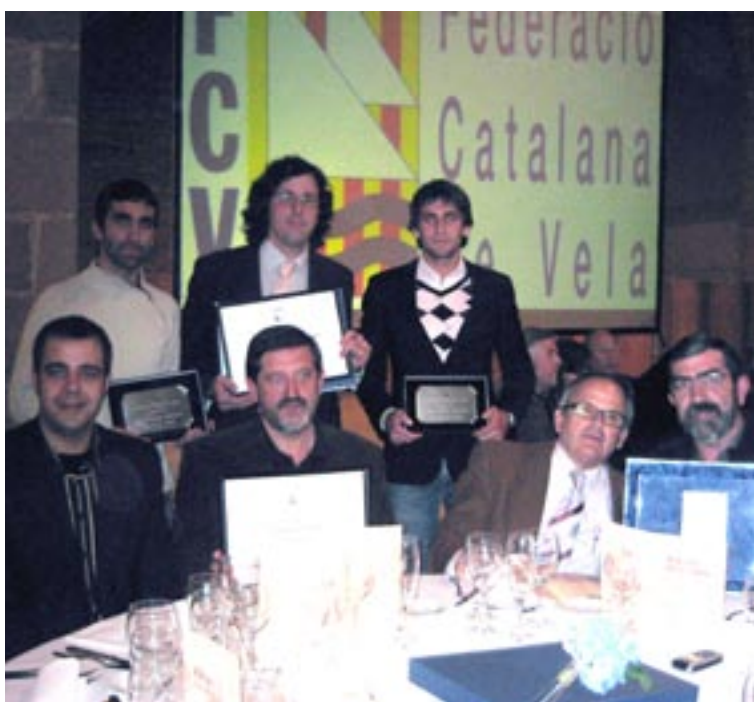
Premianencs guardonats a la Nit de la Vela

El Museu, que juntament amb d'altres d'Europa s'ha especialitzat en estampació tèxtil, és únic a l'Estat Espanyol, forma part del Sistema de Museus de la Ciència i la Tècnica, de la Xarxa de Museus Locals de la Diputació i està integrat en el Circuit de Museus Tèxtils i de Moda de Catalunya. L'entrada a l'exposició serà d'1€.