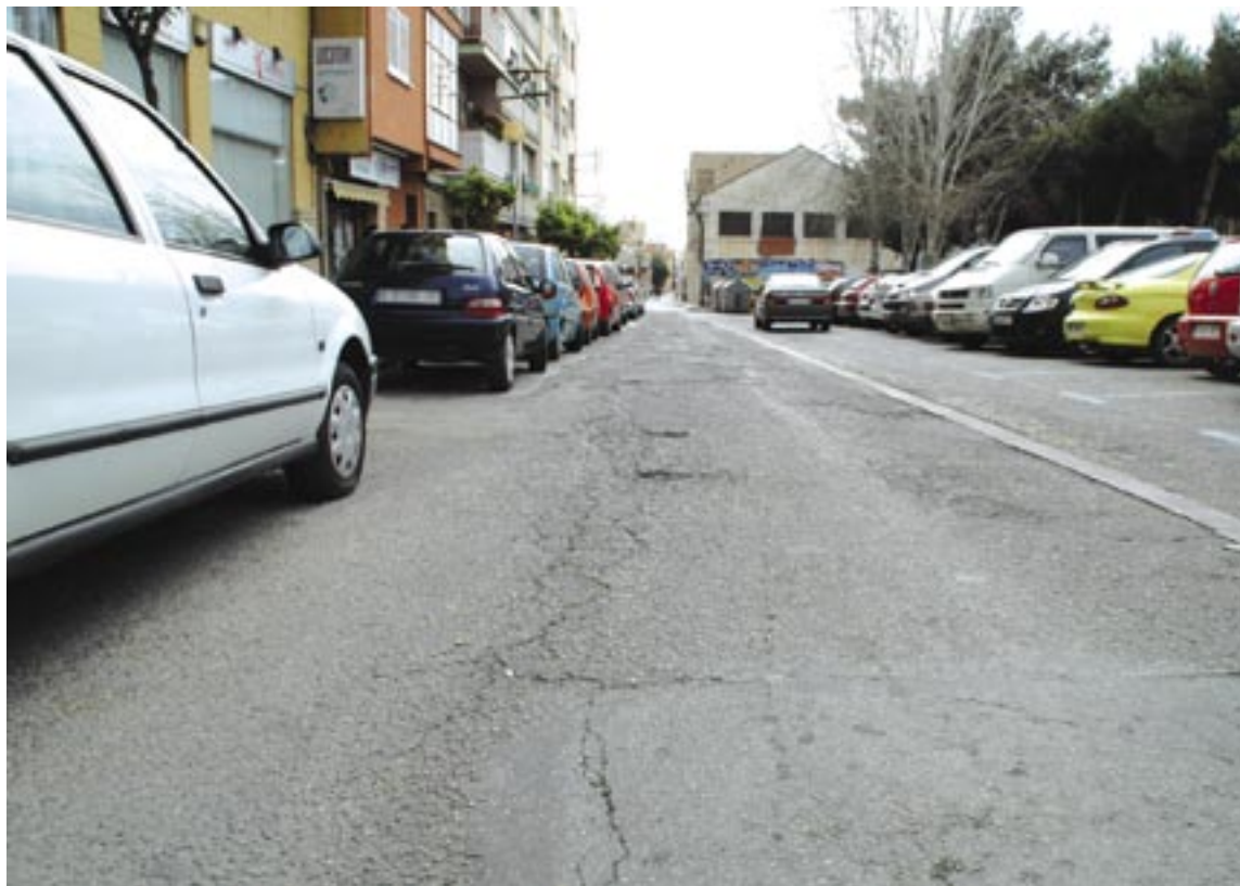
El carrer Joan Prim s'asfaltarà entre la Gran Via i el carrer Unió i entre el carrer Sant Pau i l'N-II