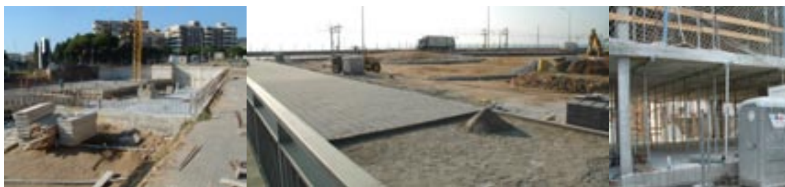
D'esquerra a dreta, obres de la nova biblioteca, la rotonda al Torrent Malet i dels pisos socials de Can Boter