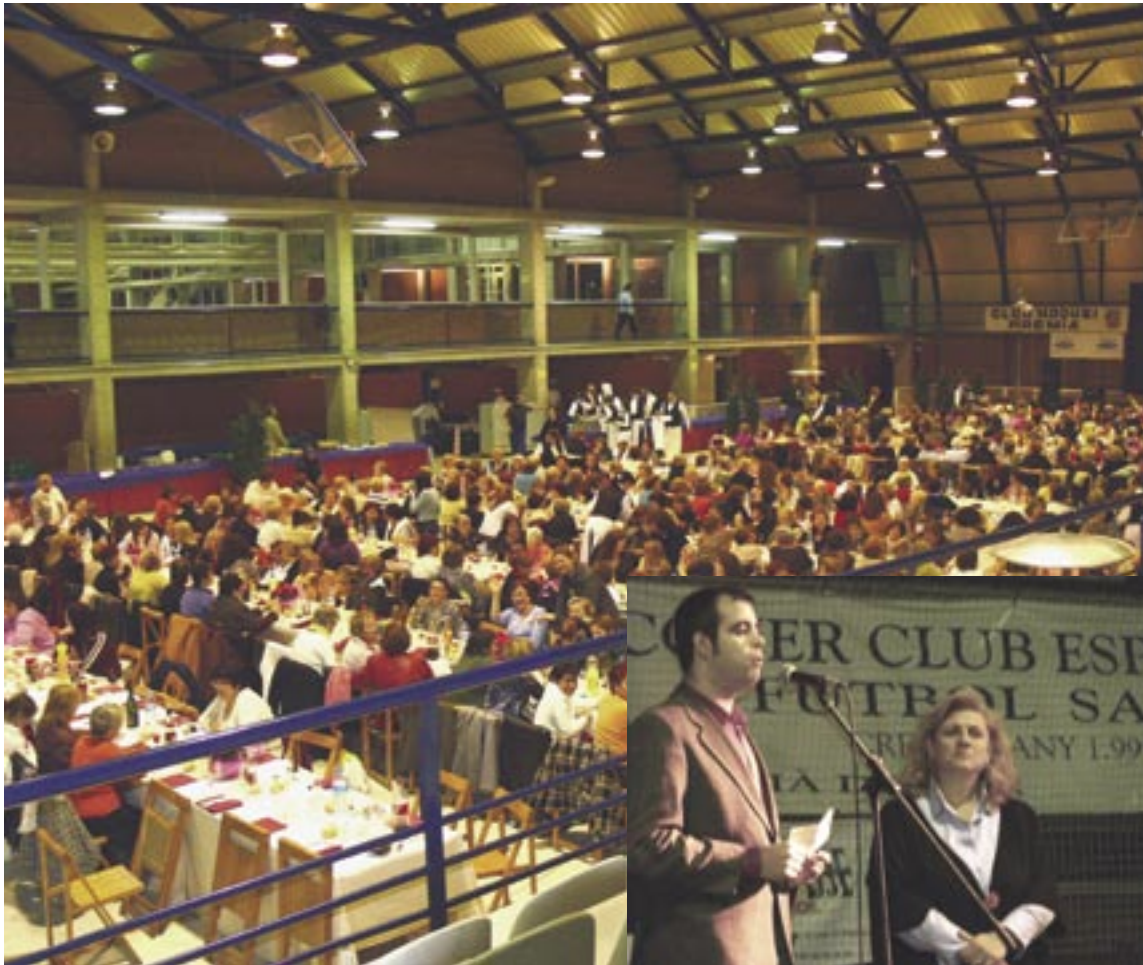
Imatge general del sopar de dones al pavelló i parlaments de Miquel Buch i Mercè Gisbert