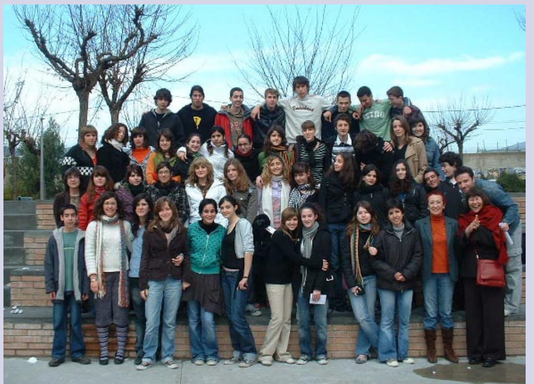
Els alumnes dels dos instituts, en la primera part de l'intercanvi el passat mes de febrer