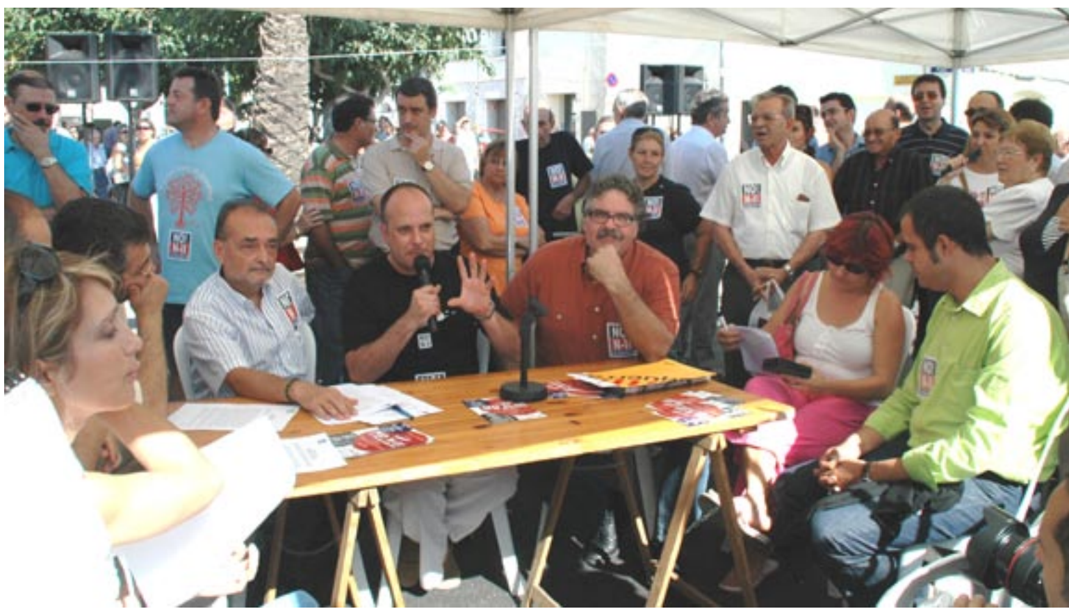
El tall massiu de la N-II va comptar amb la presència d'importants representants de la política catalana