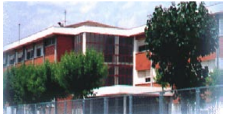
S'analitzen els usos de l'electricitat i la calefacció als CEIPS

Les ordenances són una de les principals fonts d'ingressos de l'Ajuntament. Concretament, suposen aproximadament un 50% del pressupost d'ingressos dels recursos de què disposarà el consistori durant el proper any.