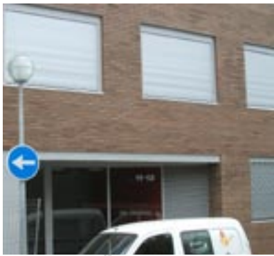
A l'esquerra, porta principal dels habitatges de lloguer estan situats al carrer Narcís Monturiol. A baix, planta tipus de l'edifici. (Plànols: Blasco-Blasco-Guerrero Arquitectes SCP)