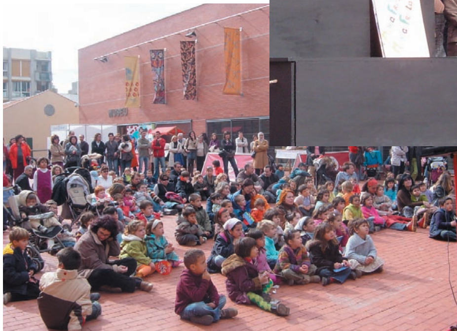
La cloenda del taller "Jo també menjo fruita" va comptar amb una gran presència d'infants