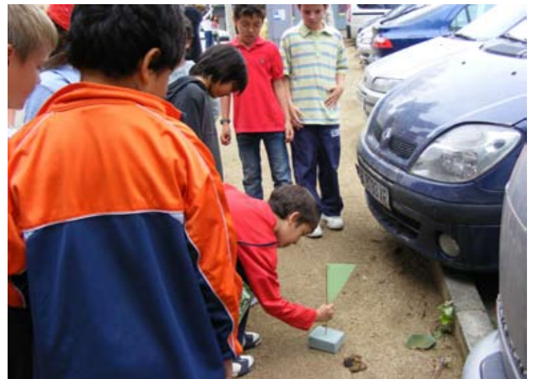
Sessió del taller al carrer

primera sessió impartida per un educador caní sobre la tinença responsable dels animals; una segona consistent en una acció a la plaça pública més propera al centre d'ensenyament, que inclou la situació d'unes banderoles confeccionades pels alumnes al costat dels excrements, per tal de fer explícit la brutícia del carrer i les places del municipi, a més d'un cartell de sensibilització dirigit als vianants; i, finalment, una tercera sessió d'assenta-