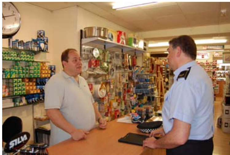
Un agent visitant un comerç

A cada visita, la Policia Local obre o actualitza una fitxa informativa sobre el comerç on s'especifica l'activitat que s'hi desenvolupa, qui n'és el titular, si disposa d'alarma dissuasòria, etc... D'aquesta