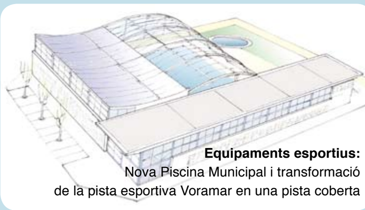
Equipaments esportius: Nova Piscina Municipal i transformació de la pista esportiva Voramar en una pista coberta