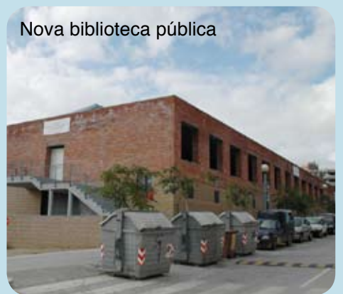
Nova biblioteca pública