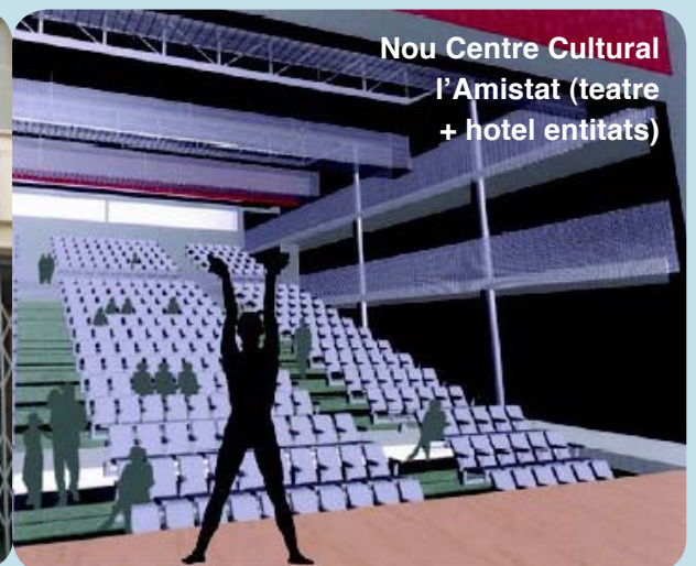
Nou Centre Cultural l'Amistat (teatre + hotel entitats)