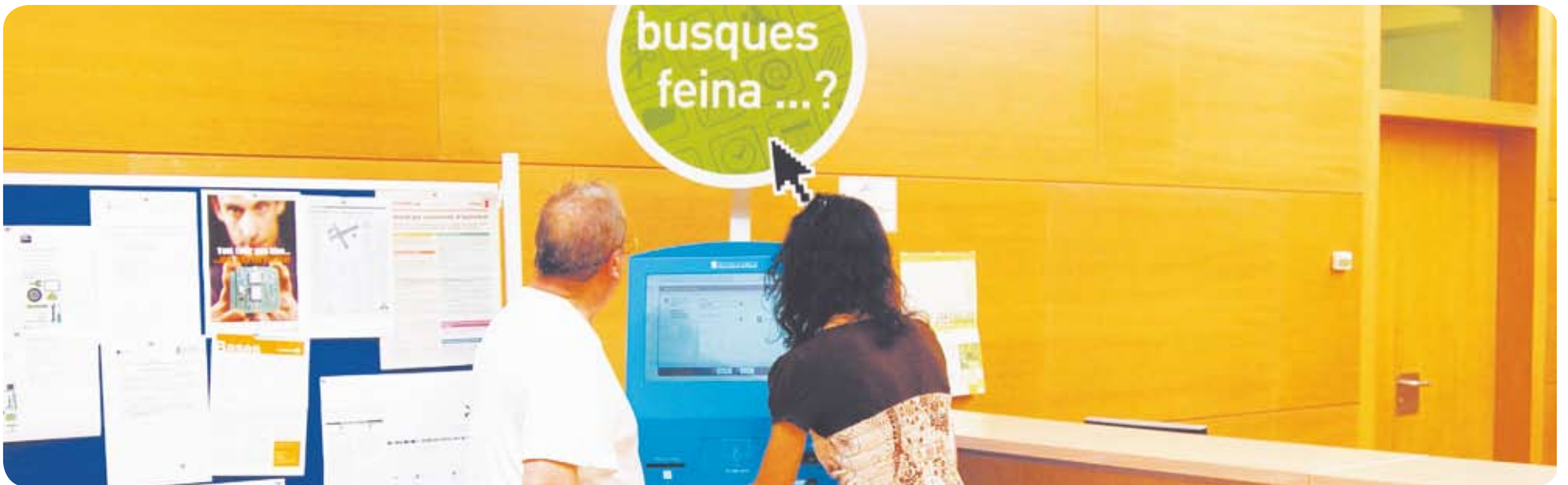
Punt d'autoservei del SOC, instal·lat a les dependències municipals de l'antiga Fàbrica del Gas