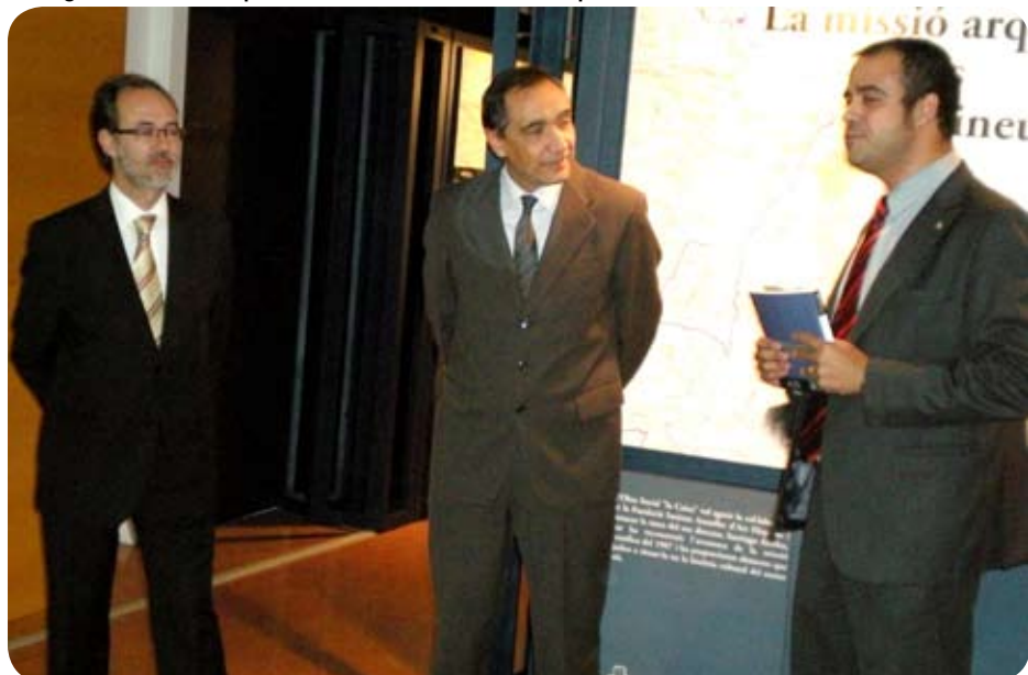
Inauguració de l'exposició al Museu de l'Estampació