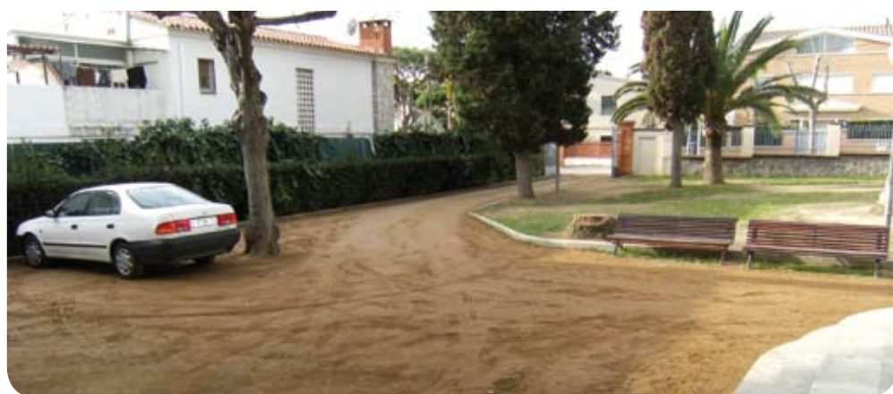
Arranjament de l'exterior de l'Escola de Música