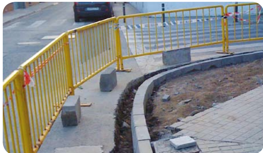
Millora de les voreres