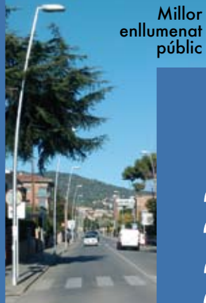
Millor enllumenat públic