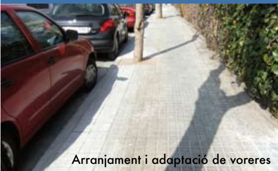
Arranjament i adaptació de voreres