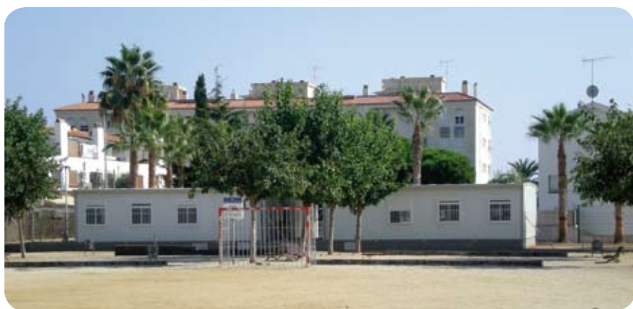
Nou CEIP Premià a Can Pou - Camp de Mar