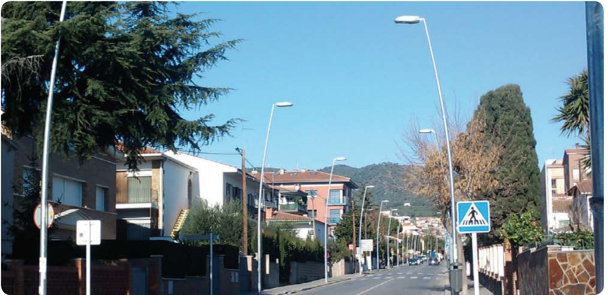
La instal·lació de nous sistemes d'il·luminació a la via pública és un dels projectes del PAM finalitzats