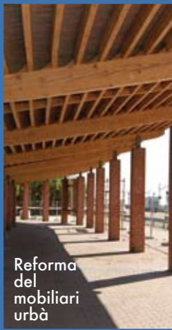
Reforma del mobiliari urbà