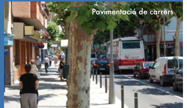
Pavimentació de carrers