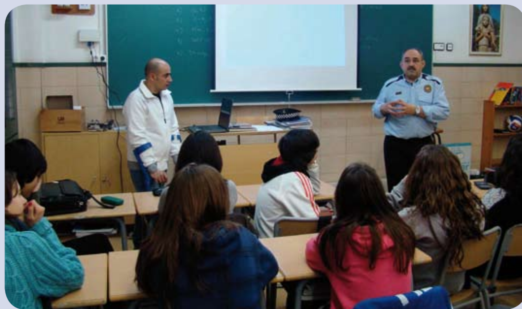
Xerrada a l'Escola Assís