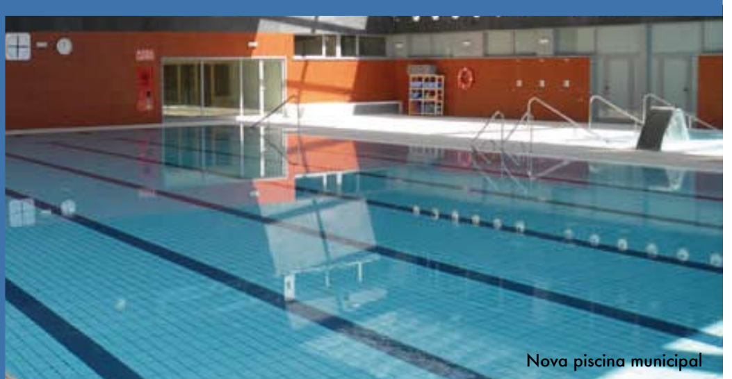
Nova piscina municipal