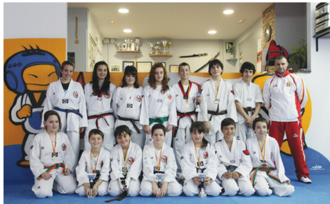
Grup de competidors

cita els millors equips del món amb un total de 2000