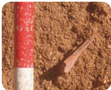
Ceràmica ibèrica visible en el tall