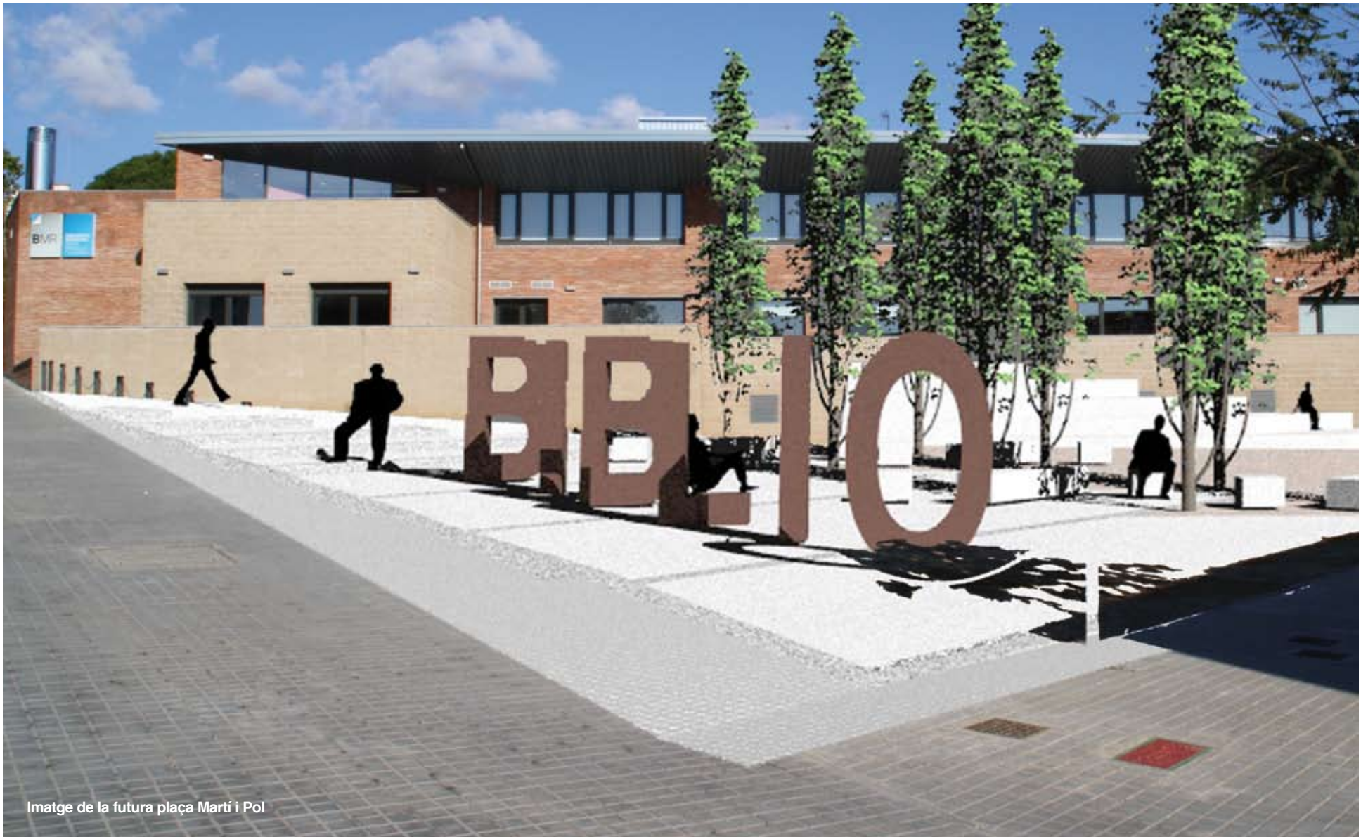
Imatge de la futura plaça Martí i Pol

Publicació mensual de l'Ajuntament de Premià de Mar • Número 65 • Nova Època • Febrer 2011