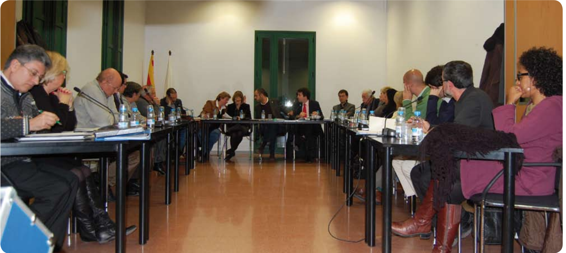
Ple del mes de gener