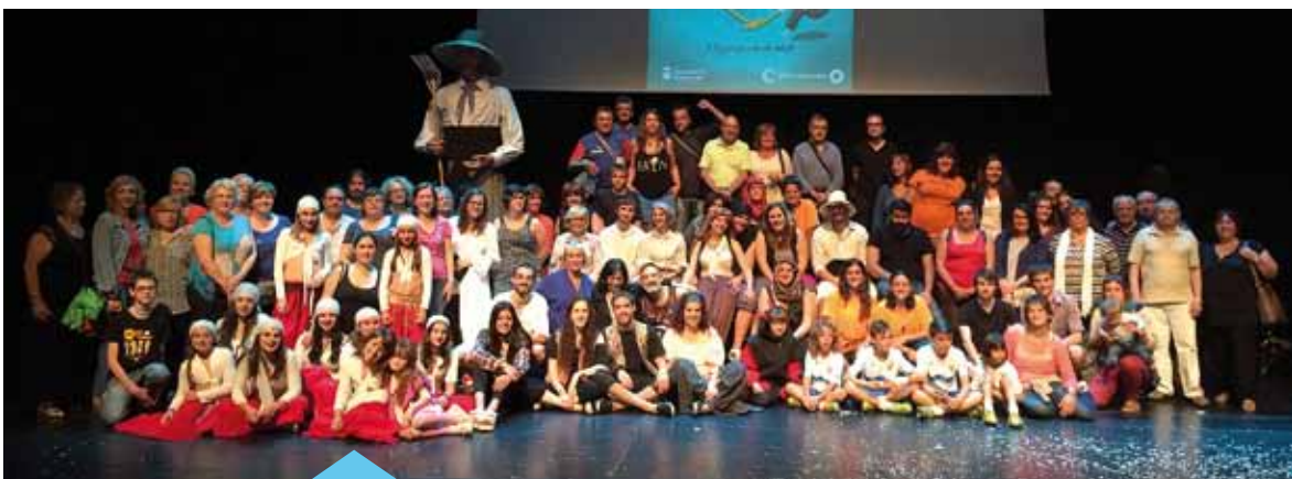
Els voluntaris de la Festa Major, durant l'acte de presentació del cartell