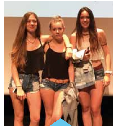
L'equip del projecte guanyador

Els altres projectes que es van presentar van ser Cinema a la fresca, de l'IES Premià de Mar; Paintball a l'estiu, de l'escola La Salle, i Guerra de Màfies (proves grupals), de l'escola Assís.