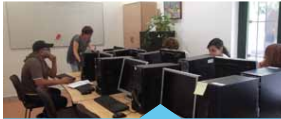
Taller sobre com elaborar un currículum

Més informació: Servei de Promoció Econòmica. Antiga Fàbrica del Gas (c/ Joan XXIII, 2-8). a/e: ocupacio@premiademar.cat. Telèfon 93 741 74 01, extensió 2000.