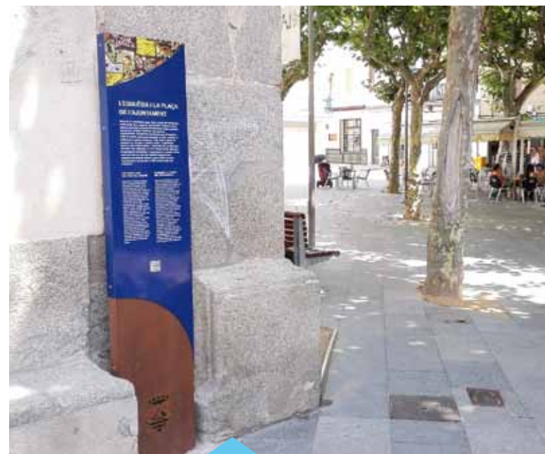
Els monòlits expliquen la història dels edificis emblemàtics

A mitjan maig es van instal·lar un total d'11 monòlits de senyalització per identificar els edificis de Can Manent, Església de Sant Cristòfol, Can Gravada, Fàbrica del Gas, Escola La Salle, Escola Assís, Patronat, l'Amistat, Cases de Cós, La Lió i Can Maristany. És un projecte subvencionat al 100% a través del programa Xarxa de Municipis de la Diputació de Barcelona, que permet una ruta cultural per donar a conèixer el valor històric i arquitectònic d'aquests edificis als premianencs i visitants. Cada monòlit conté, a més d'una explicació en català, castellà i anglès sobre l'edifici i la seva història, el disseny d'un estampat i un codi QR que remet a imatges i informacions addicionals.