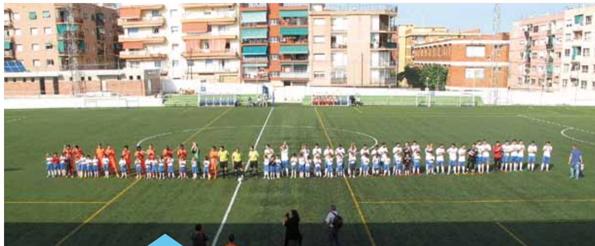
Partit del Centenari entre el CE Premià i el Barça B

El ple de maig va aprovar per assentiment que el Club Esportiu Premià, que enguany celebra el seu centenari, sigui l'entitat de l'any 2015. El CE Premià serà l'encarregat de llegir el pregó de la Festa Major, que es farà dimecres, 8 de juliol, des del balcó de l'Ajuntament.