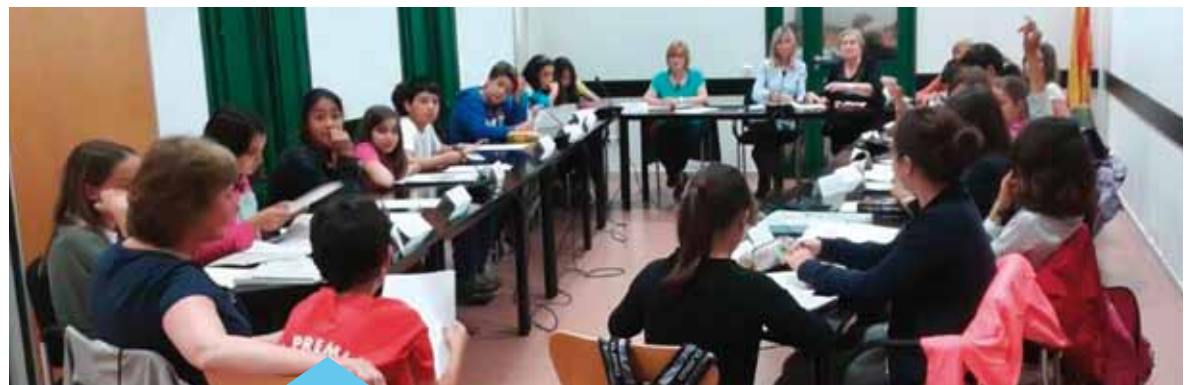
Reunió del consell d'infants a la sala de plens

nió, debatre, prendre decisions i elevar propostes al Ple Municipal. La finalitat del Consell d'Infants, format per alumnes de 5è i 6è de primària, és aconseguir que els infants se sentin part activa del seu poble, desenvolupant la capacitat crítica i fent sentir la seva veu. El treball dels consellers comença a les aules, des d'on s'inicia la recerca d'informació i el debat sobre possibles propostes.