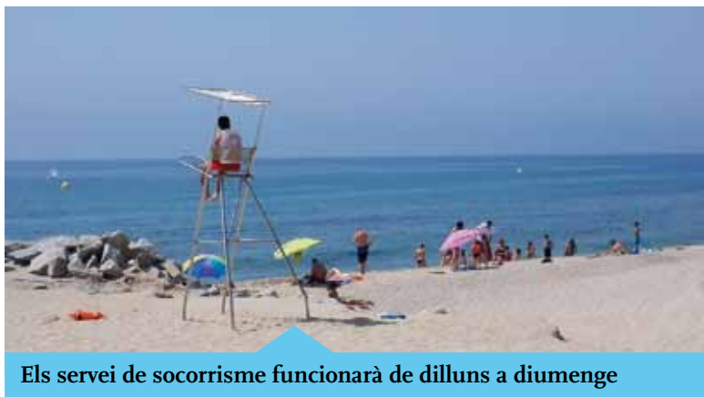
Els servei de socorrisme funcionarà de dilluns a diumenge

Al llarg de la platja hi ha un total de quatre punts de reciclatge.