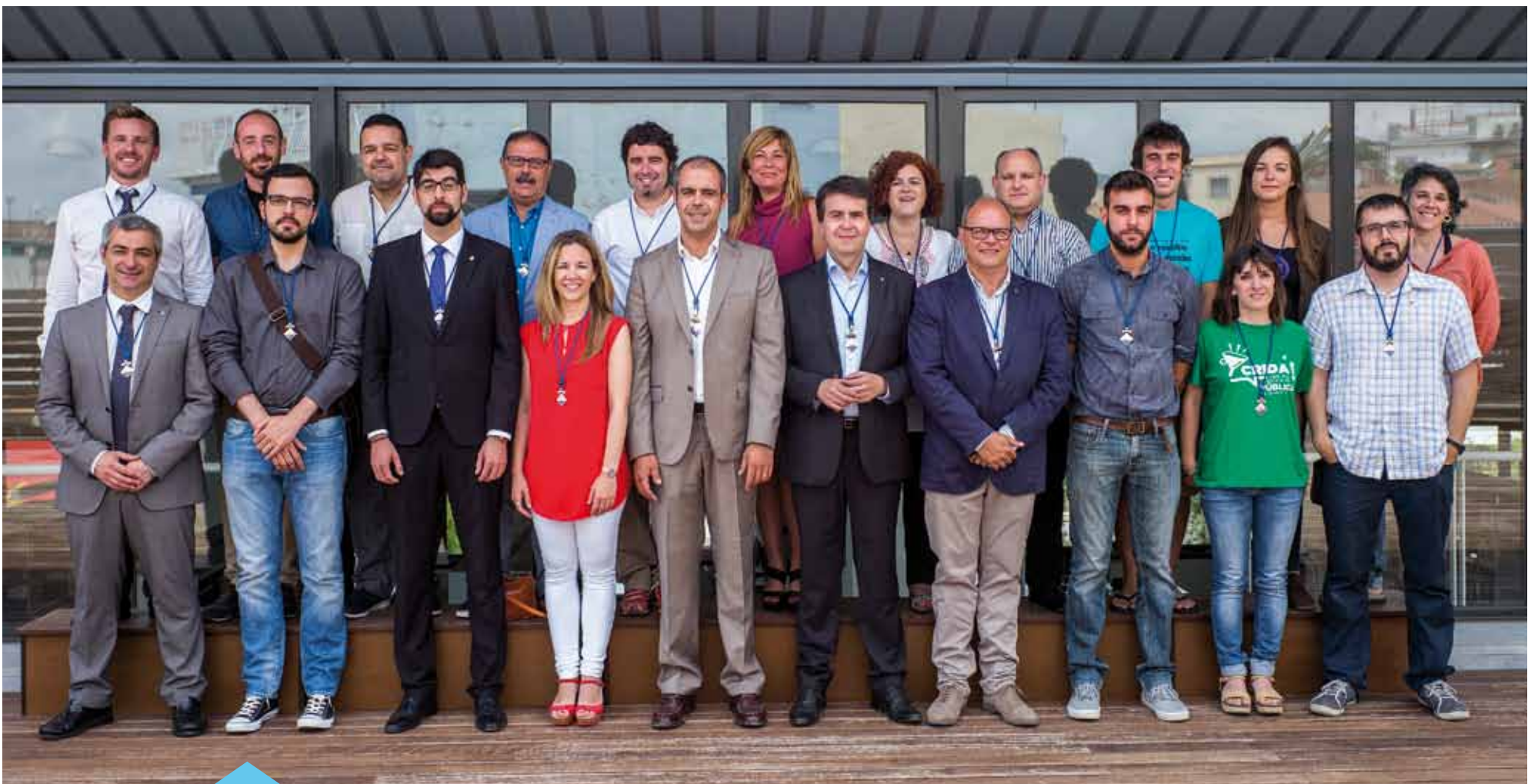
Foto de grup de tot el consistori

Respecte als possibles pactes de govern, l'alcalde va manifestar que, tot i haver parlat amb tots els grups municipals, de moment només