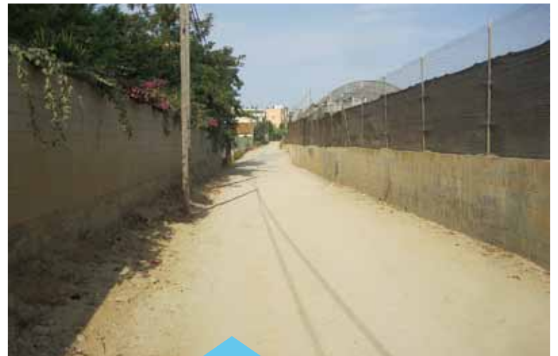
Tram del Camí de Can França

La durada de les obres es preveu que serà d'uns 3 mesos. L'import de l'obra ascendeix a 162.251 € que seran subvencionats per la Diputació de Barcelona, a través d'un conveni signat amb els ajuntaments de Premià de Mar i Premià de Dalt.