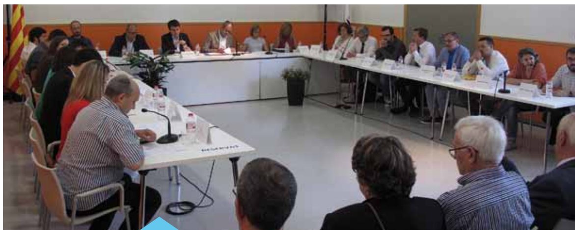
Ple de constitució del nou Ajuntament, a la sala Salvador Moragas de la Biblioteca Martí Rosselló

nia, amb humilitat però amb determinació, amb voluntat de diàleg i concertació amb la resta de forces polítiques". I va enumerar els set eixos al voltant dels quals s'articularà l'acció de govern: cohesió social; lluita contra la desigualtat i la precarització; democràcia i transparència; vida comunitària i convivència cívica; seguir teixint l'espai públic; sostenibilitat ambiental; sostenibilitat financera i una administració propera i eficient.