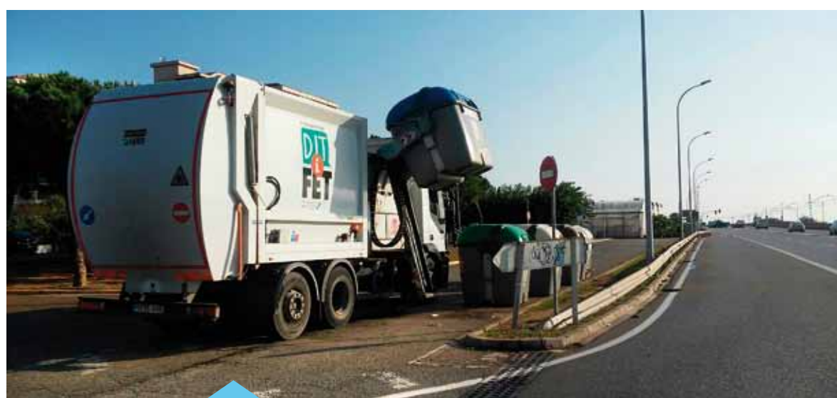
L'incompliment de les ordenances serà sancionat

(1 d'octubre a 31 de maig) Dilluns: 10.00 a 14.00 h De dimarts a dissabte: 10.00 a