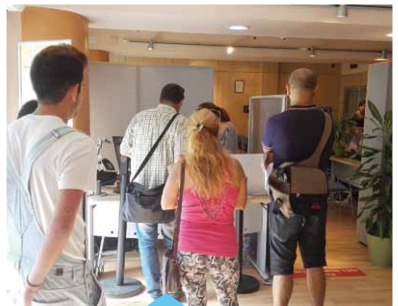
La cita prèvia evita cues i esperes

(16 de juny - 15 de setembre): - De dl. a dv. 9 h a 14 h