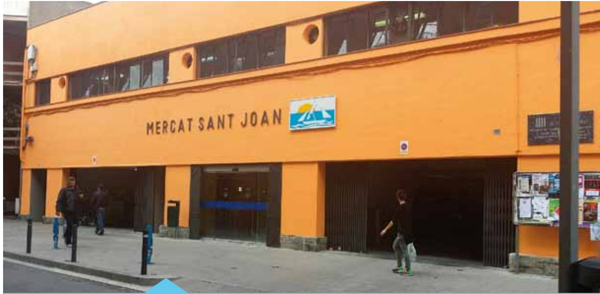
Els arranjaments s'han fet gràcies al treballadors d'un pla d'ocupació

A finals de setembre van finalitzar els treballs de reparació i pintura de la façana del Mercat de Sant Joan. Aquesta actuació s'ha fet amb un equip de 8 persones provinents d'un pla d'ocupació, coordinats per la Brigada Municipal. Actualment l'Ajuntament té 20 persones contractades a través de plans d'ocupació que estan fent diverses tasques de manteniment i jardineria.