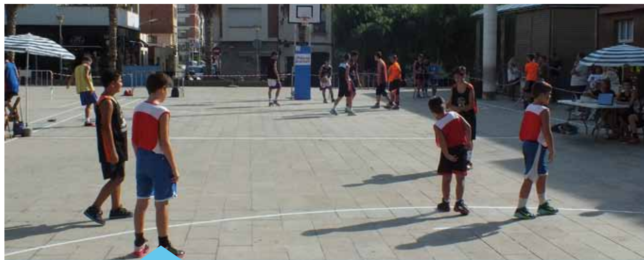
35 equips de diferents categories van participar al 3x3

El passat dissabte dia 12 de setembre, la plaça de la Sardana va acollir la dotzena edició del 3x3 Bàsquet al carrer, organitzat per l'Agrupació Bàsquet Premià de Mar, amb la col·laboració del Servei d'Esports de l'Ajuntament de Premià de Mar. Hi van participar un total de 35 equips de diferents categories. En finalitzar l'acte es va fer la presentació de tots els equips de l'entitat.