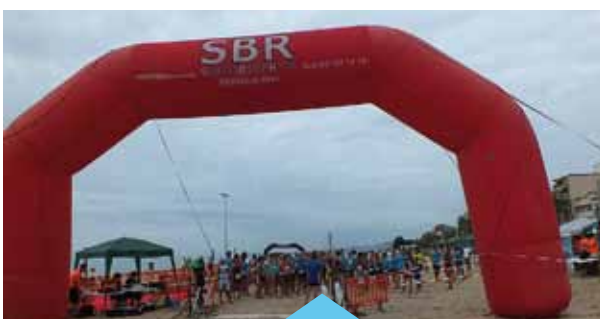
La prova es va fer a la platja del Bellamar

Diumenge 6 de setembre, es va fer a la platja del Bellamar la 3a edició de la Premiatló, a càrrec de l'empresa 7Sports i amb la col·laboració de l'Ajuntament. S'hi van fer dues proves esportives, la Distància popular, amb 3 km de cursa a peu repartits en dues fases i 300 m de natació; i la Distància Sprint, amb 5 km de cursa a peu en dues fases i 1.000 m de natació.