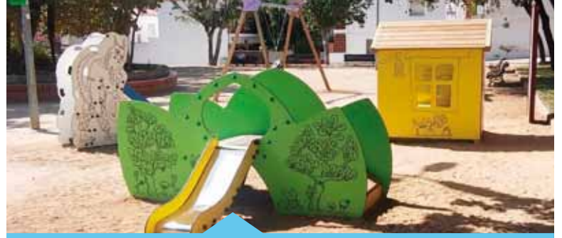
Nova àrea de jocs infantils a la plaça de Santa Rosa

Aquestes millores s'han pogut fer gràcies a una subvenció de la Diputació de Barcelona de 100.000 € per a actuacions de mobiliari urbà i parcs infantils. D'altra banda, pròximament, també a través de la mateixa subvenció, es farà una reordenació de les jardineres a diversos carrers del nucli antic i se'n col·locaran de noves.