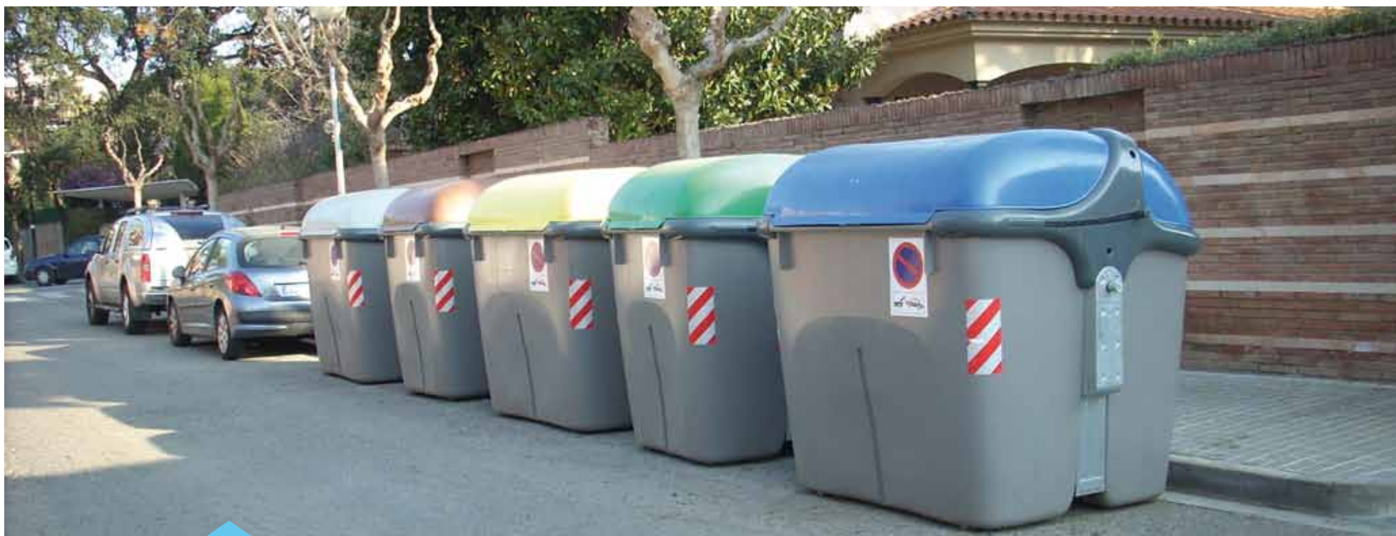
La ubicació definitiva dels contenidors finalitzarà aviat

L'objectiu d'aquests espais no és en cap cas convertir-los en pipicans sinó en zones pensades per promoure la tinença responsable d'animals i facilitar la trobada dels propietaris i les seves mascotes en un espai adequat.