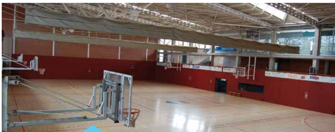
Les activitats per commemorar l'aniversari seran obertes a tothom

El 24 d'octubre es compleixen 20 anys de la inauguració del Pavelló Municipal d'Esports. Des del Servei d'Esports, juntament amb les entitats usuàries de la instal·lació, s'està treballant en l'elaboració del programa d'activitats que servirà per commemorar aquesta data. Tan aviat com sigui possible, s'informarà a través dels canals habituals de les activitats programades, que seran obertes a tothom.