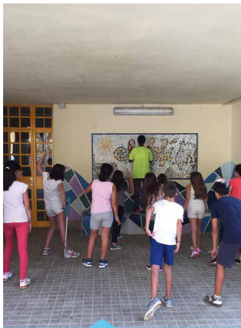
Un dels objectius que es treballa és la millora de l'èxit escolar