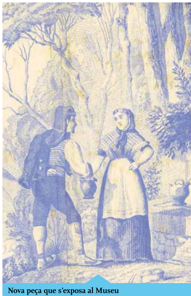
Nova peça que s'exposa al Museu