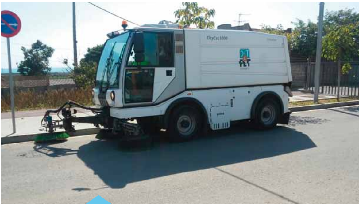
Els caps de setmana s'incrementarà el servei de neteja

Finalment, durant aquest 2015 es començaran els treballs per a la construcció de dos espais d'esbarjo per a gossos, un a la zona del Palmar i l'altre als voltants de la zona de la rotonda de Dr. Ferran.