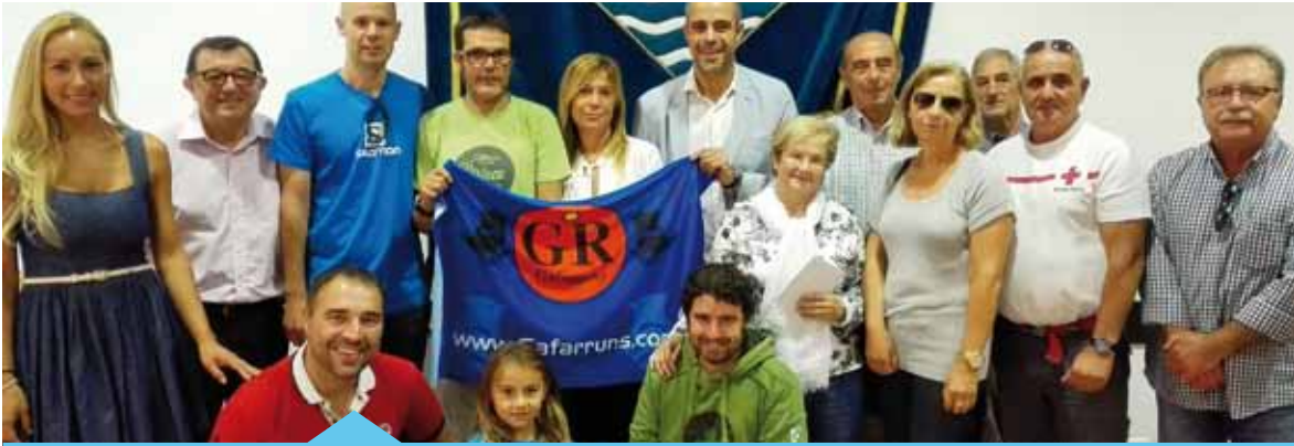
Els diners recollits es van lliurar a les entitats

La propera acció prevista dins la iniciativa de "Km solidaris" serà la Marina Trail Proide que se celebrarà a principis de l'any vinent.