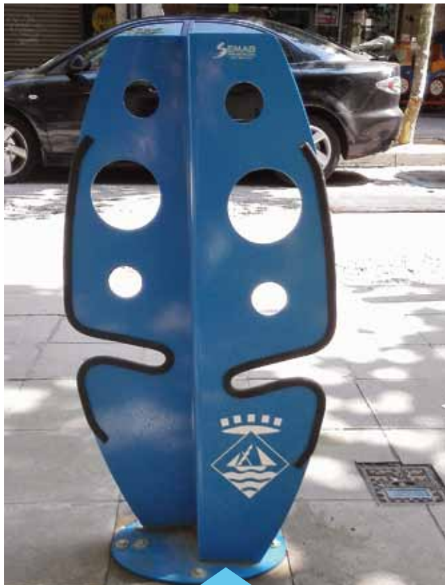
Cada aparcament serveix per a 2 bicicletes

Durant el mes de juliol es van instal·lar 8 aparcaments per a bicicletes a la Gran Via, al tram comprès entre els carrers Marina i Eixample. Els nous aparcaments estan pensats per als usuaris de bicicletes que es vulguin desplaçar a la zona comercial de la Gran Via o als voltants. Permeten lligar-hi un total de 16 bicicletes i tenen un disseny pensat per evitar-ne un estacionament permanent que pugui derivar en un mal ús.