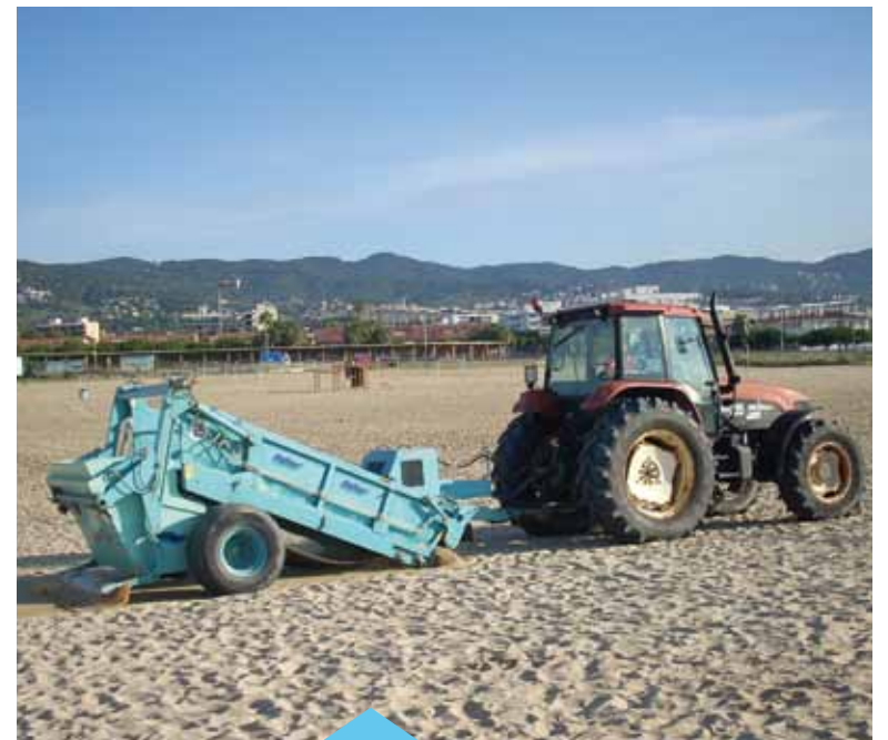
Una de les prioritats serà més rapidesa en la resolució de conflictes