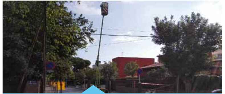
Els treballs d'esporga finalitzaran al gener

L'esporga es farà continuant amb la tendència d'esporga ecològica aplicada ja anteriorment, basada en l'aplicació de diverses tècniques de mínima intromissió segons cada una de les tipologies d'espècies, mida dels exemplars arboris, elements urbans, edificacions properes, etc.