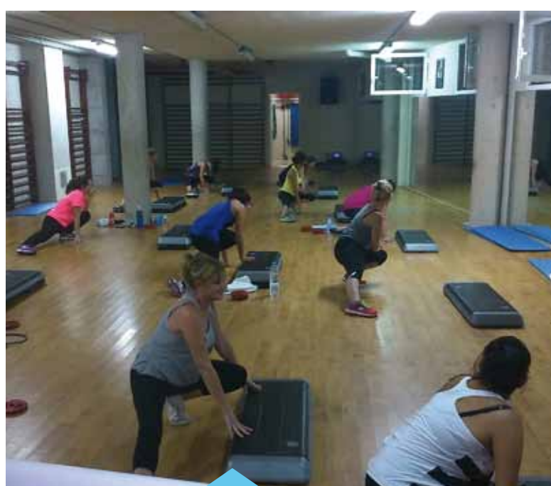
L'oferta d'activitats i horaris és variada

recepció del Pavelló Municipal d'Esports, Camí del Mig, 62.