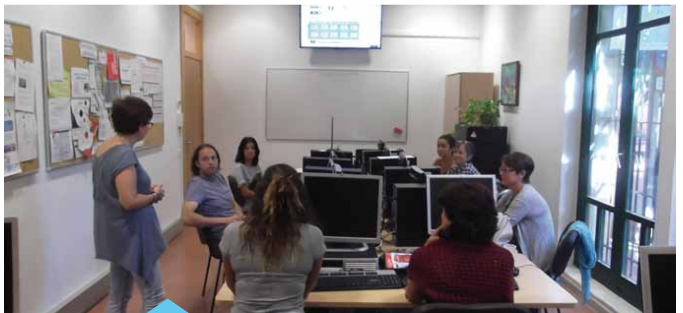
L'Ajuntament ofereix orientació i tallers per a una recerca de feina efectiva

Les persones interessades es poden adreçar a l'Antiga Fàbrica del Gas, carrer Joan XIII, 2-8 de 9 h a 13 h o poden enviar un correu electrònic a ocupacio@premiademar.cat .