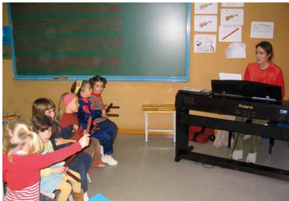
Classe d'un grup de sensibilització musical

L'Escola de Música de Premià de Mar és un servei educatiu municipal que té com a objectiu donar resposta a les necessitats musicals dels premianencs, amb una oferta àmplia i dinàmica integrada a la vida social, cultural i educativa del municipi. Com a novetat d'aquest any, cal destacar que el Departament d'Ensenyament de la Generalitat de Catalunya ha obert una línia d'ajuts econòmics per al funcionament de les escoles de música municipals. Aquests ajuts estan adreçats directament a l'escola, no a les famílies.