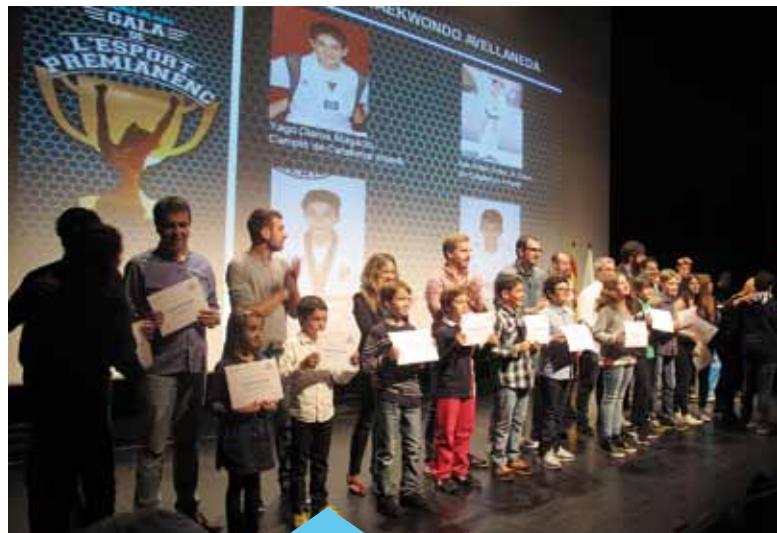
Foto de família dels esportistes premiats amb els regidors

El 6 de novembre va tenir lloc a l'Espai l'Amistat la Gala de l'Esport Premianenc, com a reconeixement dels esportistes que han assolit èxits esportius al llarg de la temporada 2014-2015. A l'acte hi van assistir prop de 300 persones, es van donar 58 diplomes i 6 reconeixements especials.