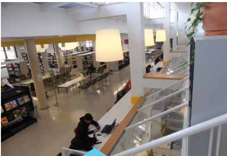
En 5 anys s'han fet prop de 300.000 préstecs

Des de la seva inauguració, l'abril del 2010, la Biblioteca Martí Rosselló i Lloveras ja rebut 1.041.428 visitants (fins al 26 de novembre). Al llarg d'aquests 5 anys s'han fet prop de 300.000 préstecs i més de 1.000 activitats. Actualment, els usuaris inscrits o amb carnet de préstec superen els 10.600.