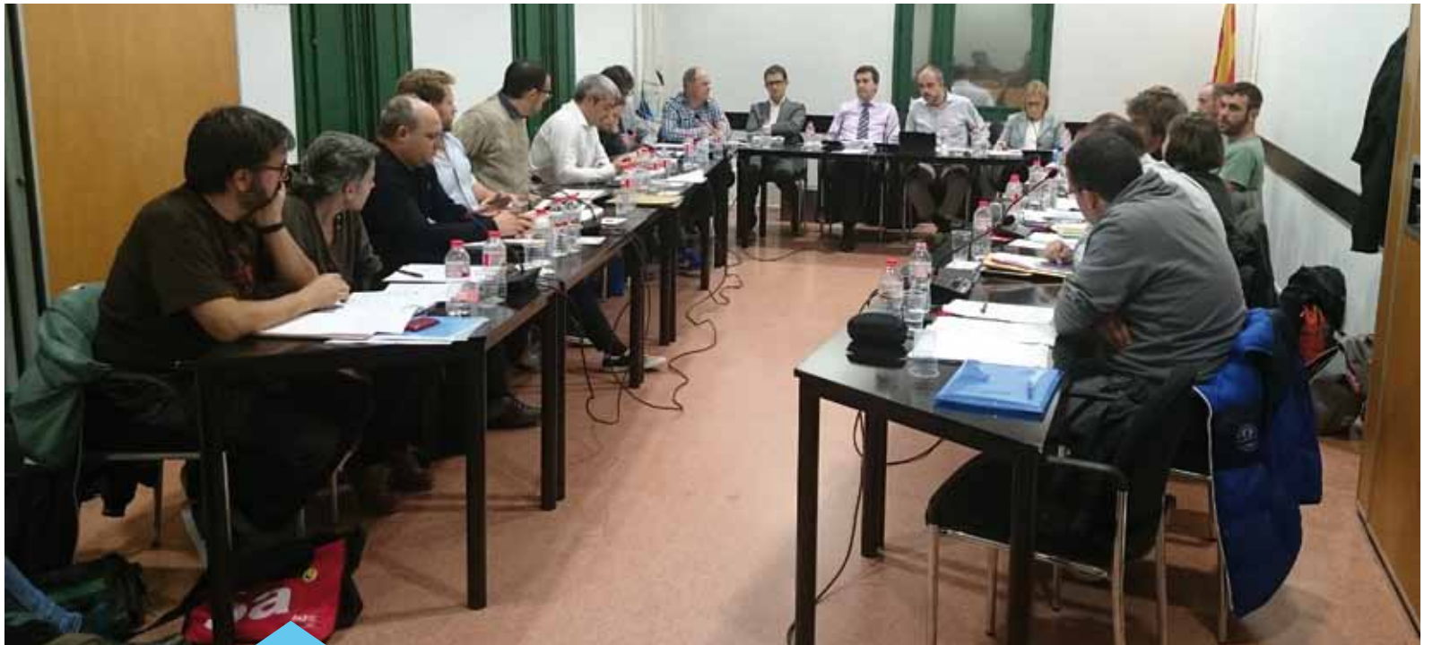
El ple de novembre, durant l'aprovació del pressupost

La principal novetat del pressupost és que per primera vegada es presenta de manera analítica, és a dir que la ciutadania pot conèixer el cost real de cada activitat o servei, tenint en compte tant les despeses directes com les indirectes. Alhora, amb aquest nou plantejament, l'Ajuntament pot fer una valoració més precisa dels serveis que presta, ja que en té el detall del cost total.