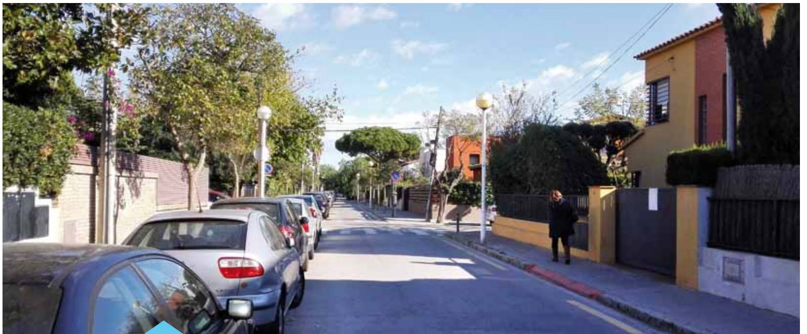
Bona part de l'enllumenat públic es renovarà

El pressupost per al proper any és de 21.982.210 (un import superior al del 2015, que era de 19.664.977) i en total es destinaran prop de 3M d'euros a inversions, un terç dels quals provenen del romanent del 2015. La inversió més gran, amb un total de 833.241 €, es destinarà a la millora de les instal·lacions de l'enllumenat dels carrers del municipi. En aquest sentit, cal destacar l'estudi que ha fet la Diputació de Barcelona sobre quin ha de ser el nou model d'enllumenat públic dels propers anys. Cal recordar que al mes d'abril de 2016 finalitza el contracte d'enllumenat públic.