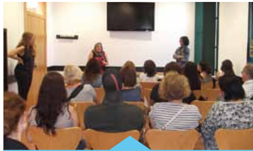
Al curs hi van participar 15 persones

El darrer curs per a persones aturades orientat a treballar als comerços va finalitzar amb èxit. En total hi van participar 15 persones que van obtenir formació teòrica i van poder fer 80 hores de pràctiques a diverses empreses. Un cop finalitzat el curs, i per tant també el període de pràctiques, 4 d'aquestes persones van ser contractades per les mateixes empreses.