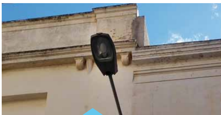
El nou enllumenat serà amb bombetes led

blic i a finals del passat mandat els grups municipals van acordar que s'havia de tirar endavant un nou model i es va demanar assessorament a la Diputació de Barcelona en aquest sentit.