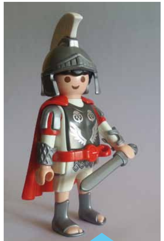
La mostra de l'any passat va ser un èxit

L'Institut d'Estudis Catalans ha elaborat un recull dels monuments commemoratius de les ciutats catalanes en el qual surten tres monuments commemoratius de Premià de Mar. Es tracta dels monuments dedicats a Oriol Martorell (ubicat a la plaça Oriol Martorell, de l'any 1995); l'Agrupació Coral l'Amistat (a la plaça Nova, des del 1971); i Rafael Casanova (plaça de Can Manent, 1995). El recull inclou més de mil tres-cents monuments i cada un va acompanyat d'una fitxa en la qual consta el tema, la ubicació, l'autor, les característiques, informació complementària i la imatge. Les fitxes de cada un dels monuments es poden consultar a la pàgina web monuments.iec.cat.