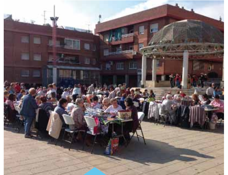
La festa va aplegar 160 persones