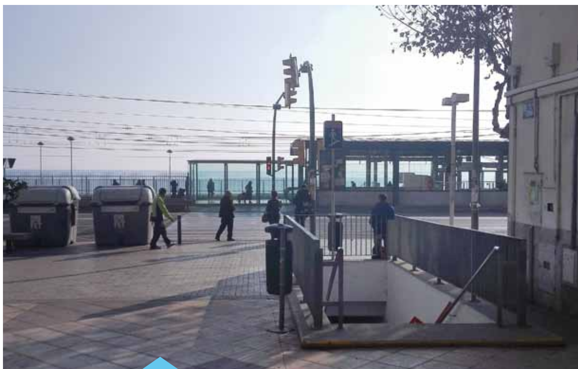
La inversió de l'accés a l'estació es reclamarà a ADIF