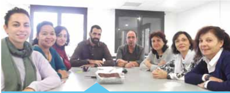
Els participants van fer sessions individuals i de grup

El suport s'ha desenvolupat en diverses fases en les quals els participants han rebut un suport psicològic orientat a millorar el seu estat emocional. D'aquesta manera, s'aconsegueixen canviar els pensaments i emocions negatius per altres de més adients i per tant millo-