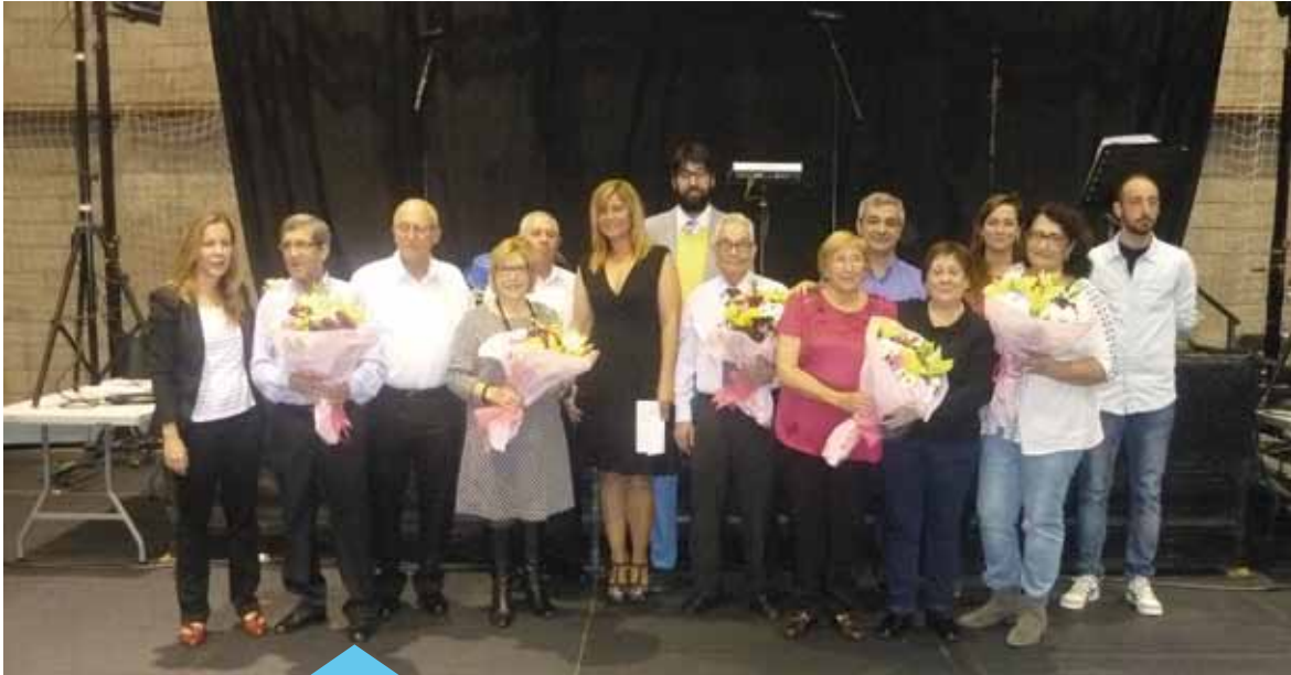
Reconeixement a les parelles que han celebrat les noces d'or

La festa, que feia 5 anys que no se celebrava, va ser organitzada per Conex, amb la col·laboració de l'Ajuntament. Hi van participar unes 160 persones provinents d'una vintena d'entitats i va comptar amb la participació dels grups de country de Conex.