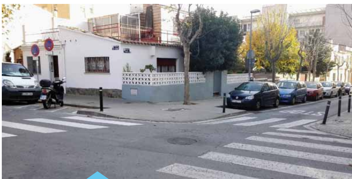
Es destinaran 120.000 € per arranjar voreres