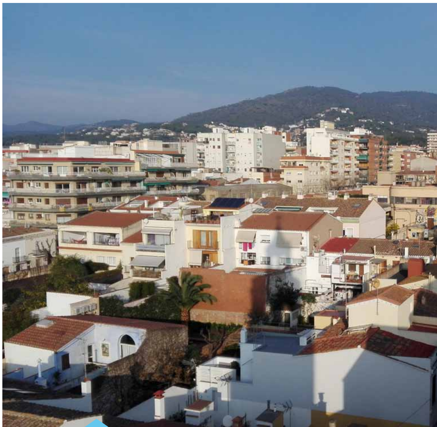
El Pla d'actuació municipal es divideix en 8 eixos

El propassat 25 de gener es va presentar, en un acte obert a tothom el Pla d'actuació municipal per a l'actual mandat. El document, elaborat per l'equip de Govern amb la col·laboració de les diverses àrees de l'Ajuntament, se centra en 8 grans eixos, cada un dels quals es desglossa en un seguit de compromisos que es portaran a terme entre aquest 2016 i el 2019, així com el calendari previst per a cada una de les accions. El PAM 2016-