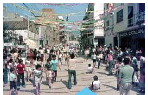
Una de les imatges de l'exposició

L'exposició anirà acompanyada d'un col·loqui, que se celebrarà el 19 de febrer a les 19.30 hores i d'una projecció d'imatges, que es farà el 26 de febrer a les 19.30 h.