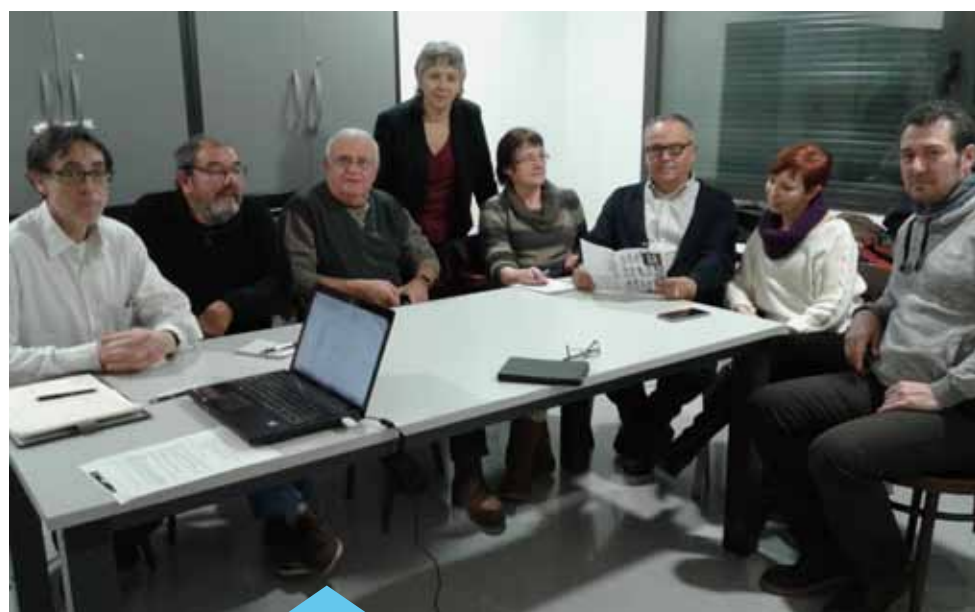
Membres del grup fotogràfic Argent

Hi va haver gent que de seguida es va posar a treballar amb el nou sistema i n'hi va haver d'altra que els va costar més perquè tenien la idea que això del digital no aniria enlloc i no tenia qualitat. De fet, al principi les càmeres tenien molt poca resolució i no arribaven a la qualitat de la fotografia analògica. La gent s'aferrava al laboratori químic, però de mica en mica tothom s'ha pas-