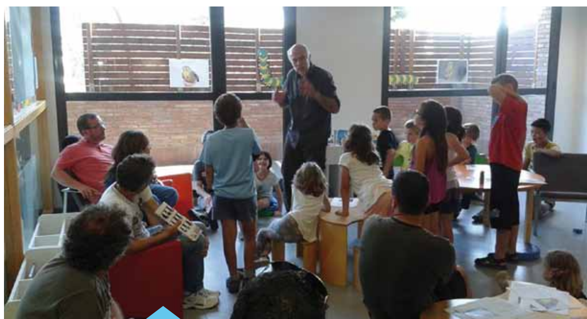
La biblioteca organitza diverses activitats per fomentar la lectura

Les inscripcions a aquestes activitats es pot fer a la mateixa biblioteca o telefonant al 93 751 01 45.