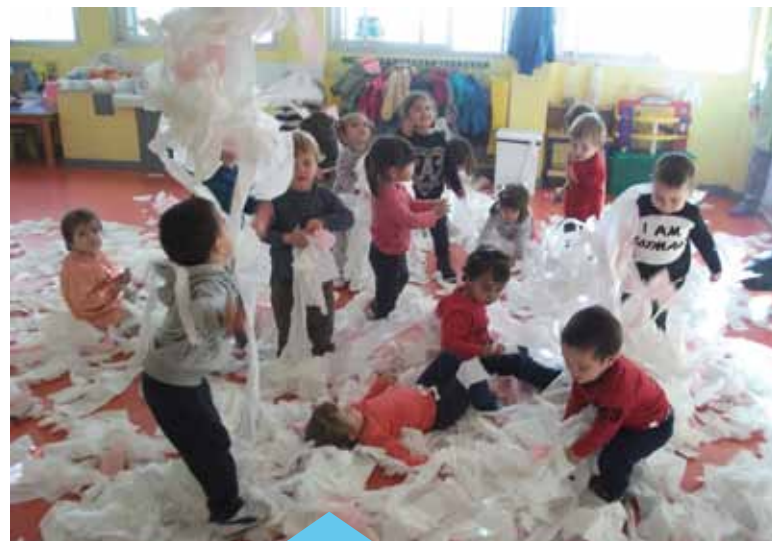
El plàstic es va substituint per la fusta i elements d'ús quotidià

D'altra banda, el claustre de mestres ha començat a modificar el material de les joguines. A poc a poc es van retirant els materials de plàstic per introduir joguines de fusta o elements d'ús quotidià com ara pots de diferents mides, culleres de cuina, mànegues, anelles, claus, petxines, rotllos de paper...etc. que són els que agrada més als infants. Tot plegat sense oblidar mai que "el seu ofici", la seva principal necessitat, no és cap altra que el joc, lliure, propi i espontani.