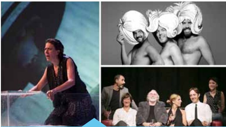
Cartellera del primer trimestre de 2016