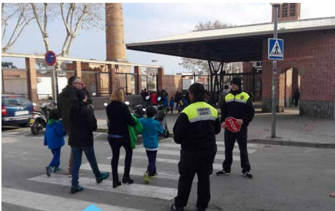
Els agents cívics fan tasques per millorar la convivència ciutadana

A finals de desembre es van incorporar a l'Ajuntament 14 persones, fins aleshores en situació d'atur, que durant 6 mesos desenvoluparan diverses tasques. Onze d'aquestes persones estan treballant com a agents cívics en diverses campanyes pensades per millorar la convivència ciutadana. En aquest sentit, els agents estan fent campanyes als parcs i espais públics per evitar actituds incíviques i possibles molèsties entre els usuaris; tasques de suport a la policia local per reforçar el servei de vigilància durant l'horari d'entrada i sortida de les escoles; campanyes informatives per evitar que no es recullin els excrements de gos o que es deixi la brossa a fora dels contenidors; i campanyes de reforç amb els comerços perquè es faci el reciclatge de la brossa de manera correcta, entre altres.