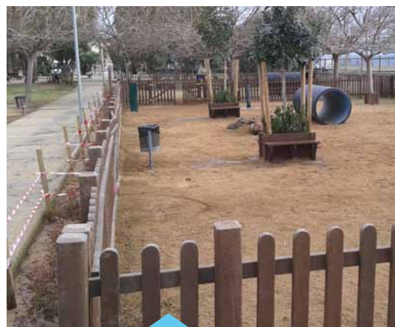
L'espai compta amb elements per a l'esbarjo dels gossos

Aquest 2016 l'Ajuntament té prevista la construcció d'una segona zona d'esbarjo per a gossos, de la qual s'està valorant la ubicació.