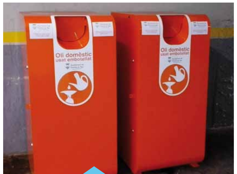
Els nous contenidors eviten vessaments

El Mercat Municipal de Sant Joan compta amb dos nous contenidors per llençar-hi l'oli de cuina. La diferència d'aquests contenidors respecte a l'anterior és que en els actuals l'oli es llença juntament amb el recipient (de vidre o de plàstic) en el qual s'ha anat recollint a casa. D'aquesta manera, s'eviten vessaments i acumulació de brutícia i envasos buits al voltant dels contenidors. Cal recordar que llençar l'oli de cuina usat a l'aigüera és altament contaminant i perjudicial per al medi ambient. A banda de provocar males olors i generar problemes a les canonades, contamina els rius i el mar i no desapareix. En canvi, si es llença en un contenidor adequat, es pot reciclar i convertir en sabó, biodièsel o pintura.