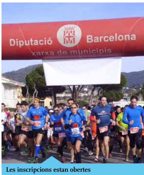
Les inscripcions estan obertes

El proper 28 de febrer tindrà lloc la IV Edició de la cursa de muntanya Marina Trail, organitzada per la Fundació Proide, amb la col·laboració del Servei d'Esports. La cursa, que integra els municipis de Premià de Mar, Teià i Premià de Dalt, va néixer arran de la iniciativa d'un grup de voluntaris d'aquesta ONG a l'escola La Salle Premià. Hi haurà tres tipus de cursa segons recorregut i intensitat: una de 22 km, una de 12 km i la Cursa Kids per a infants menors de 12 anys, amb recorreguts d'entre 100 i 1500 metres. Més informació i inscripcions a marinatrail.cat .