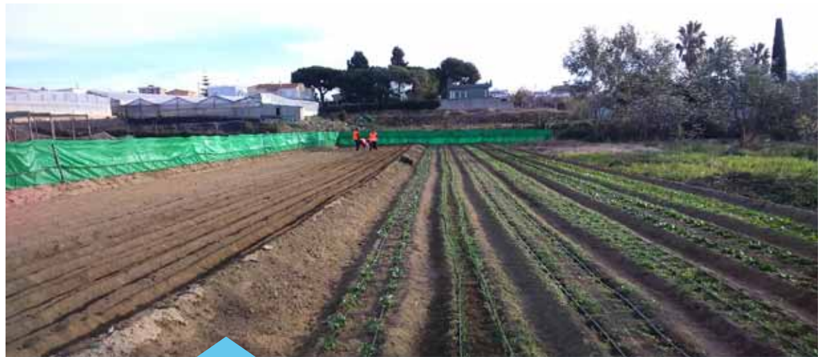
Les persones que treballen els horts reben la formació necessària

En el moment de fer a collita, el producte es repartirà entre les persones participants i, si hi ha excedent, s'oferirà al centre DISA Premià. Aquest projecte pot servir de prova pilot per a futurs projectes alternatius d'autogestió.