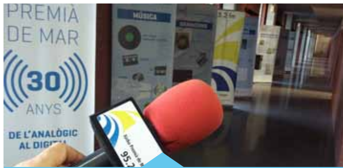
L'estudi es va fer el desembre de 2015

Cal afegir-hi també, els ciutadans que escolten l'emissora en línia amb la nova aplicació o els serveis de podcast. Des del mes de gener al desembre de l'any 2015 s'han efectuat un total de 249.853 descàrregues d'àudios. L'emissora ha diversificat la seva presència i l'oferta de continguts a través d'un ampli ventall de plataformes, entre les quals les xarxes socials, en aquest cas també han experimentat un important augment tant de continguts com de seguidors. La ràdio, així com Internet, són els únics mitjans que en l'àmbit nacional han experimentat un notable increment d'audiència en els últims sis anys. Gràcies a aquest augment de la penetració en l'audiència, s'arriba a més ciutadans i, en conseqüència, la ràdio continua essent un dels mitjans més eficaços per connectar amb la ciutadania.