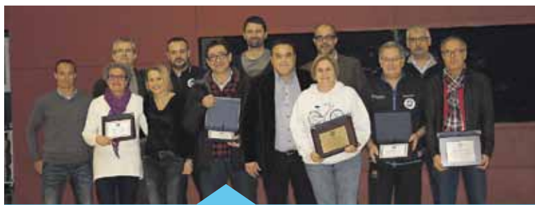
La presidenta sortint va rebre un homenatge

La Junta entrant va voler agrair públicament l'esforç i el bon treball de tots els components de l'anterior Junta.