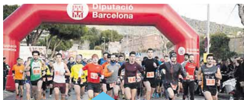
La cursa solidària va recaptar 4.100 €

El 28 de febrer, prop de 700 corredors de totes les edats van participar en la quarta edició de la Marina Trail Proide, la cursa de muntanya amb sortida i arribada a La Salle Premià. La cursa va tenir un caràcter totalment solidari, ja que tots els beneficis van destinar-se al finançament de cursos de formació professional en un barri marginal de Lima (Perú). En total, es van recaptar prop de 4.100€. Enguany, la Marina Trail va consolidar els circuits de 21 km. per als més agosarats, un circuit d'inciació al trail-running de 12km i curses infantils (les Traca-Trails) per a alumnes d'infantil, primària i ESO.