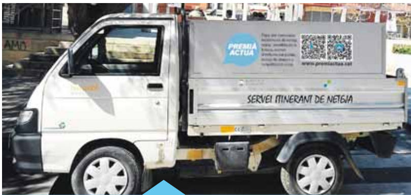
El vehicle amb una rotulació simulada

La posada en marxa d'aquest servei forma part de les mesures impulsades des de la Regidoria de Medi Ambient per millorar la neteja viària. Aquestes mesures es van començar aplicar la tardor de l'any passat i estan centrades en tres eixos: la lluita contra l'incivisme, una millora de l'eficàcia del servei i la resolució de temes conflictius.