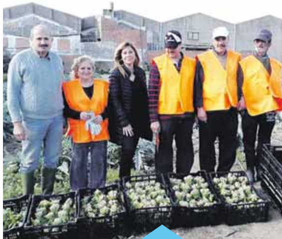
Els horts solidaris fan possible l'autoconsum a persones aturades de llarga durada

Les primeres collites van ser d'espinacs, bledes i faves, posteriorment ja s'hi ha pogut collir patates i maduixes. Un cop feta la collita, el producte es reparteix entre les persones participants en el projecte i, si hi ha excedent, s'ofereix al centre DISA Premià.