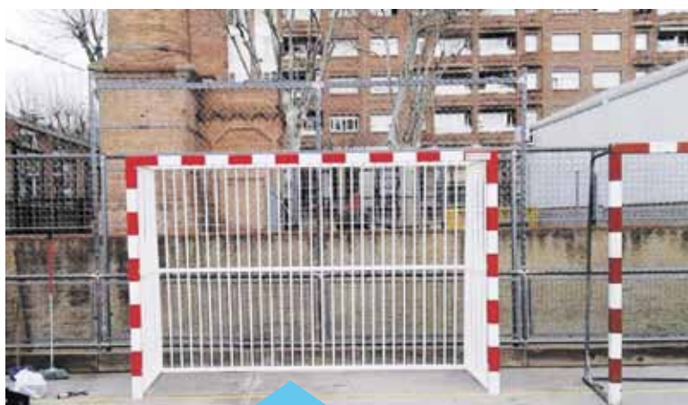
Les noves porteries són de futbol sala i handbol

Fa unes setmanes, l'Escola La Lió va estrenar porteries de futbol sala i handbol. La Regidoria d'Esports té la previsió d'anar reposant, en la mesura que sigui possible i amb la coordinació del Departament d'Ensenyament, el material esportiu de les escoles que no estigui en bones condicions. El cost de les porteries ha estat de 1.694 €.