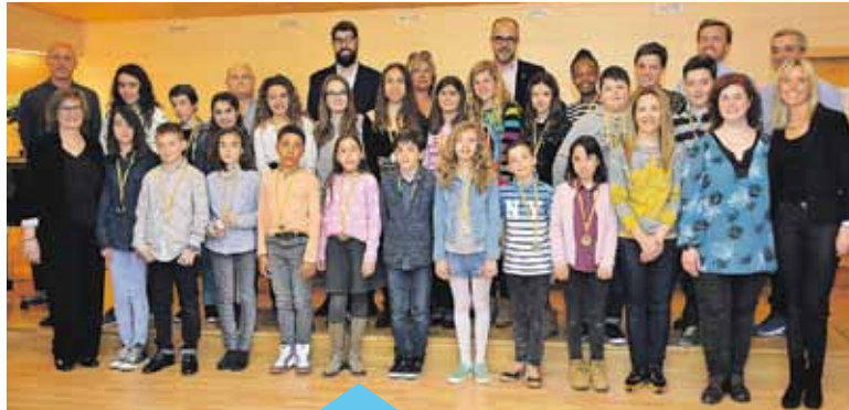
Alcalde i regidors van donar la benvinguda als nous consellers