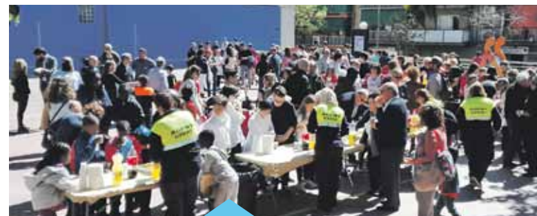
Agents cívics d'un pla d'ocupació a l'acte celebrat a la plaça Maresme

Més informació: ocupacio@premiademar.cat