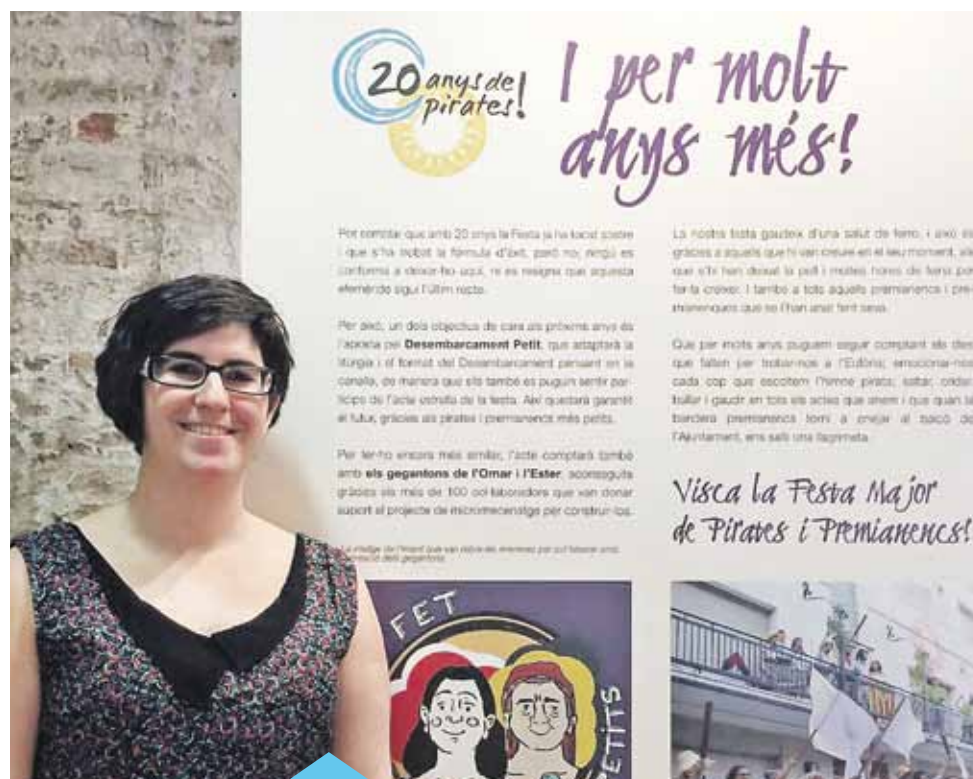
L'exposició dels 20 anys de la Festa Major es pot veure al .MEP fins el 24 de juliol

En el moment de treballar i fer la feina de recerca per l’exposició, dels primers anys hi ha poquíssim material i aquest són uns formats que ara han quedat obsolets. Ens ha costat molt trobar aquest material. I també una de les feines de futur que ha de tenir la comissió és començar a preservar tot aquest material, perquè d’aquí 20 o 30 anys endavant es pugui recuperar. Estaria bé poder disposar d’un ar-