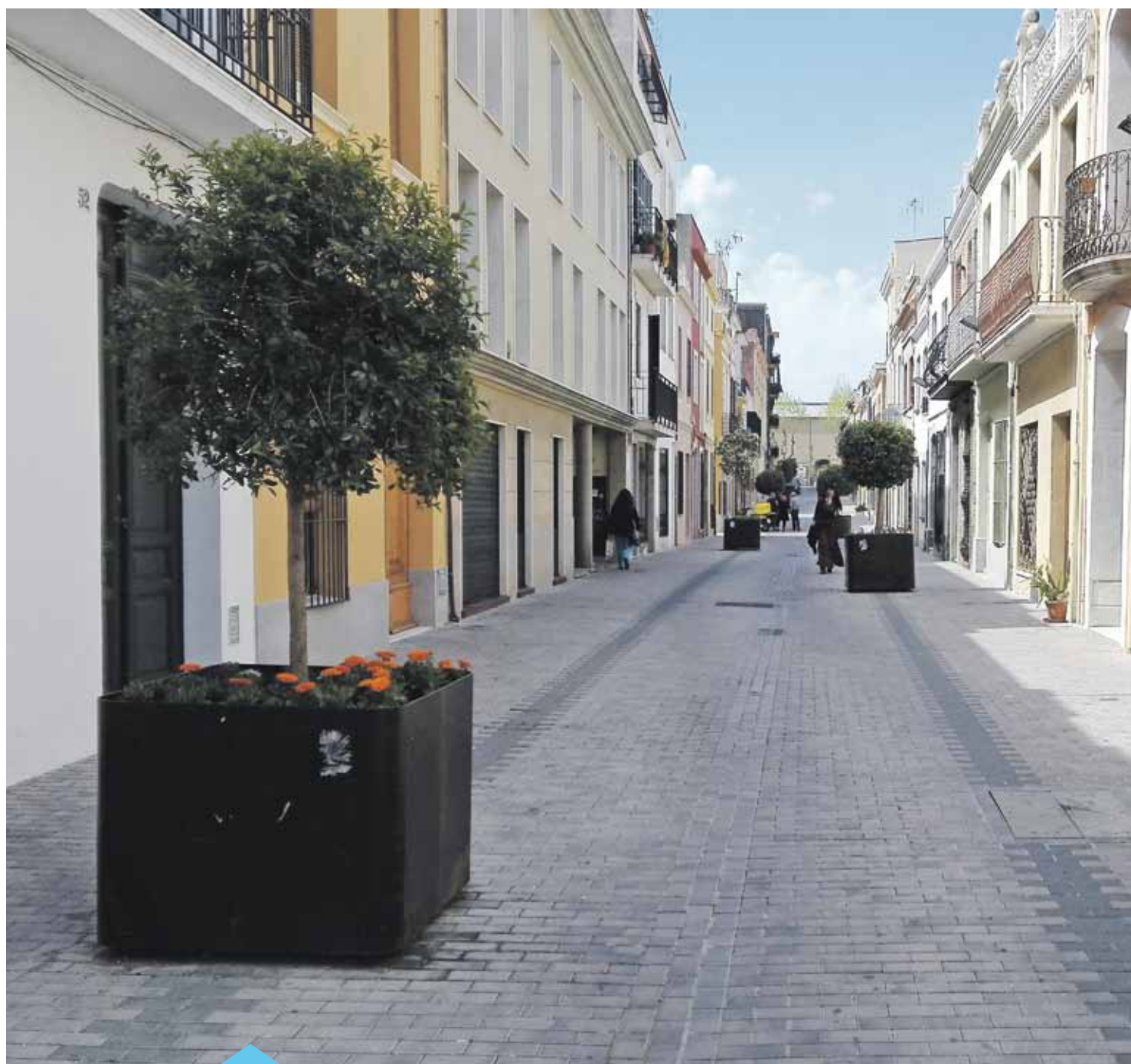
Circuit verd al carrer Gibraltar, amb vegetació que afavoreix l'equilibri i la defensa contra plagues

El primer corredor biològic de Premià de Mar ja està en marxa. El projecte, pioner a la comarca, farà possible que el municipi compti amb un circuit format per zones verdes naturalitzades i petits ecosistemes.