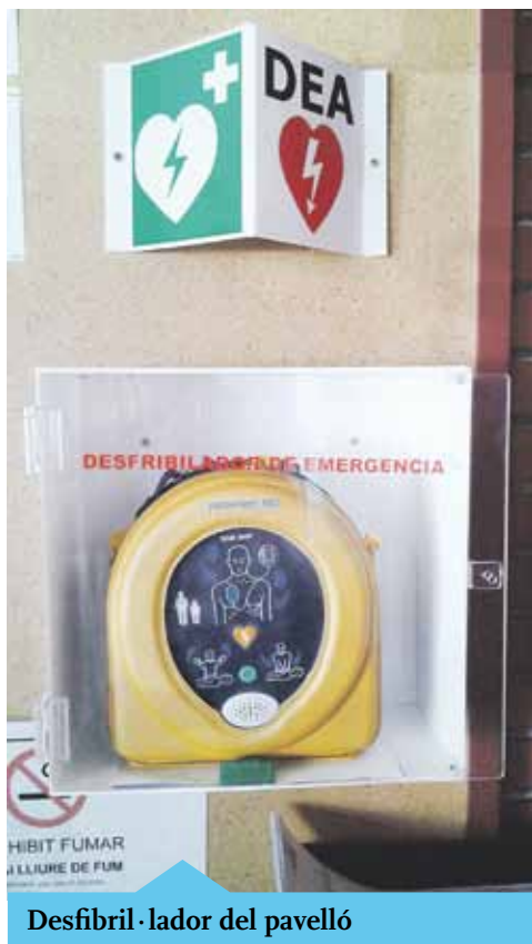
Desfibril·lador del pavelló

Actualment hi ha un desfibril·lador al Pavelló Municipal d'Esports i un altre al camp de futbol, i properament s'instal·larà un tercer aparell al Pavelló Voramar.