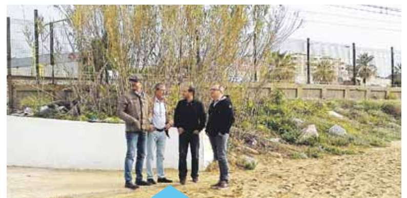
Alcaldes i regidors d'urbanisme sobre el terreny

D'altra banda, els consistoris veïns també estan d'acord a millorar el camí que, a la banda interior de la carretera N-II, uneix el barri de Can Pou-Camp de Mar de Premià de Mar amb el Mercat de Flor i Planta Ornamental de Catalunya, a Vilassar de Mar, un camí molt freqüentat sobretot els diumenges quan es fa el mercat a l'aire lliure a l'exterior de les instal·lacions del Mercat de Flor. Els consistoris volen consolidar aquest camí per tal de millorar la seguretat dels vianants que el transiten.