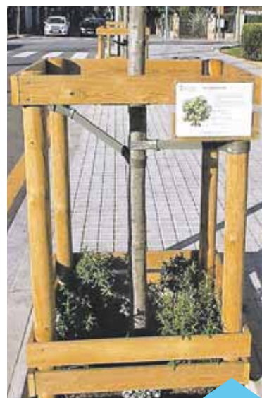
Zones verdes naturalitzades i petits ecosistemes enllaçaran places i carrers

Finalment, el cartell dóna a conèixer, de manera molt gràfica, la denominació dels arbusts i herbes que s'hi han plantat, i també de l'arbre que envolta l'escocell.