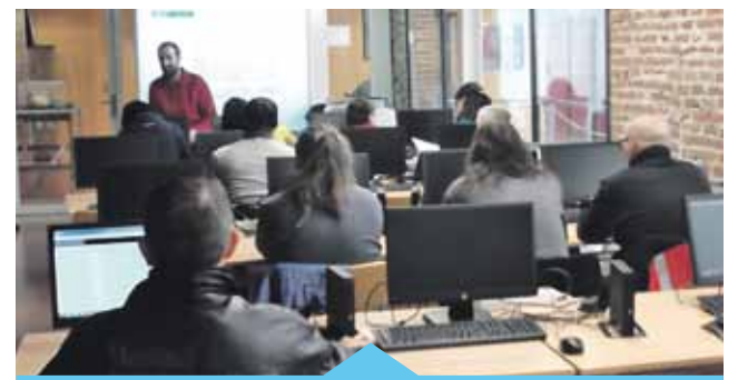
L'Ajuntament compta amb 2 aules homologades

Servei d'ocupació (antiga Fàbrica del Gas. Carrer Joan XXIII, 2-8) Tel. 93 752 91 90 ocupacio@premiademar.cat