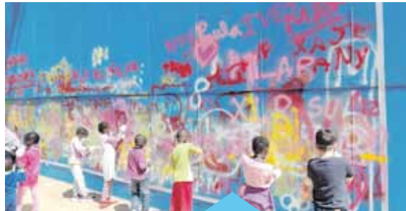
Veïns pintant el mural de la plaça Maresme

Aquestes empreses desenvoluparan una tasca participativa de recollida d'informació, propostes i queixes a partir de les quals es portaran a terme les actuacions a curt i mitjà termini per millorar el barri.