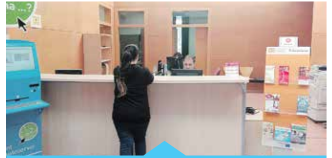
Servei d'Ocupació, ubicat a l'antiga Fàbrica del Gas

Més informació: Servei d'Ocupació de l'Ajuntament de Premià de Mar. Joan XXIII, 2. Telèfon 93 752 91 90. ocupacio@premiademar.cat