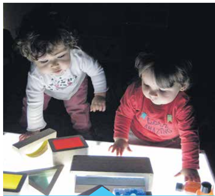
Les portes obertes seran el 24 d'abril

Les preinscripcions es poden fer del 2 al 12 de maig.