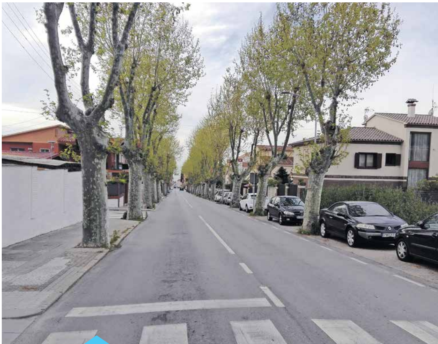
Una de les actuacions previstes serà a la carretera de Premià de Dalt i barri Banyeres