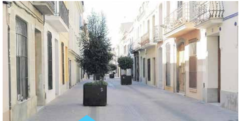
El projecte d'urbanització del Nucli Antic es preveu que s'ampliarà

Actualment s'ha fet gairebé un 90% del projecte, tot i que se'n preveu l'ampliació, atesa la demanda per part dels veïns.