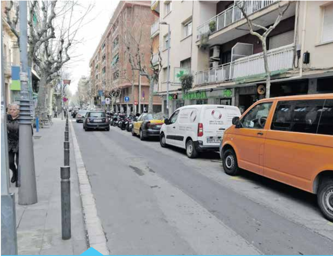
La Gran Via entre els carrers de la Plaça i Joan Prim serà de plataforma única