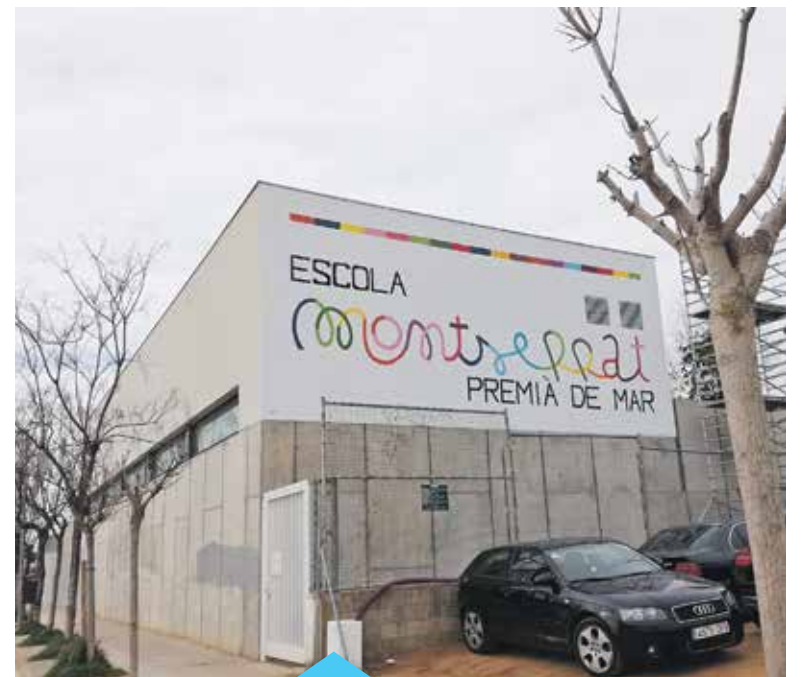
El nou rètol era una demanda de l'escola

Durant el mes de març es va pintar a la façana de l'Escola Montserrat un nou rètol identificatiu amb el nom del centre. La petició s'havia fet des de la mateixa escola amb l'objectiu de donar-li més visibilitat.