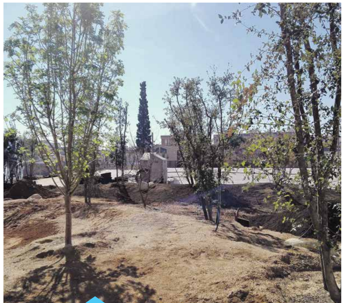
Els treballs d'enjardinament de la plaça Salvador Moragas estan força avançats