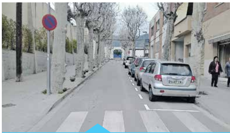
El carrer de la Plaça entre Núria i Mercè ara és de sentit únic

El pressupost del 2017 inclou un projecte de millora integral amb el qual s'arranjarà el clavegueram entre els carrers de la Plaça i Joan Prim i, alhora, aquest tram passarà a ser de plataforma única. El projecte ja està encarregat i aquest any se'n farà la licitació. Les obres, inicialment previstes a finals d'any, començaran a principis del 2018 a petició de les associacions de comerciants, ja que d'aquesta manera els treballs no perjudicaran la campanya de Nadal.