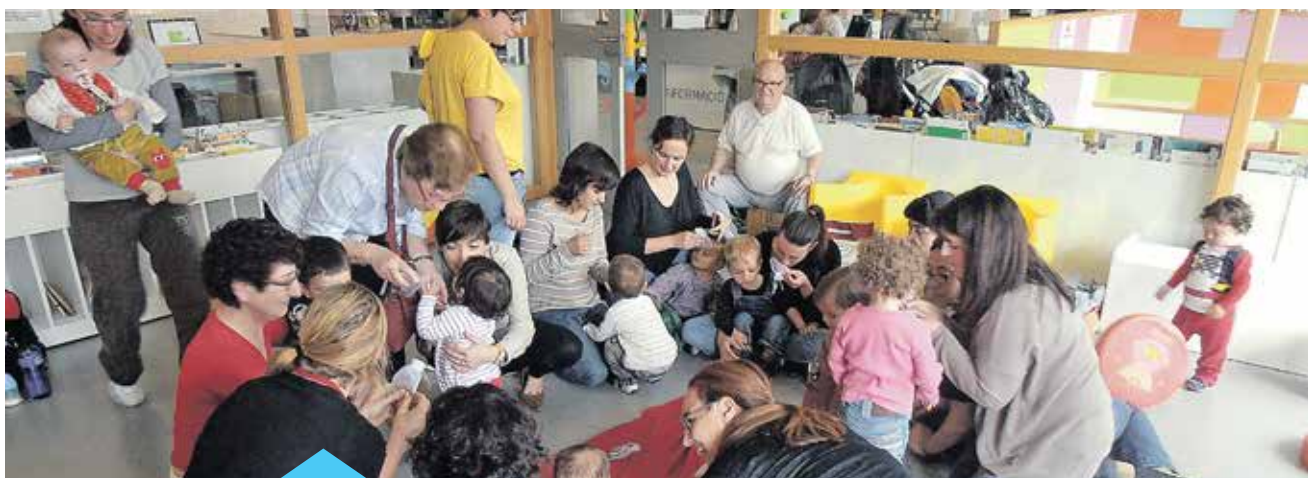
Les sessions de l'hora del conte es fan per a nadons i per a infants fins a 4 anys

El sorteig serà públic i es farà cada darrer divendres de mes al Centre Cívic. El primer sorteig es farà el 28 d'abril, el segon, el 26 de maig i el darrer, el 30 de juny. Cada un dels guanyadors obtindrà quatre entrades per poder gaudir de les millors estrenes en cinema digital a l'Espai l'Amistat.