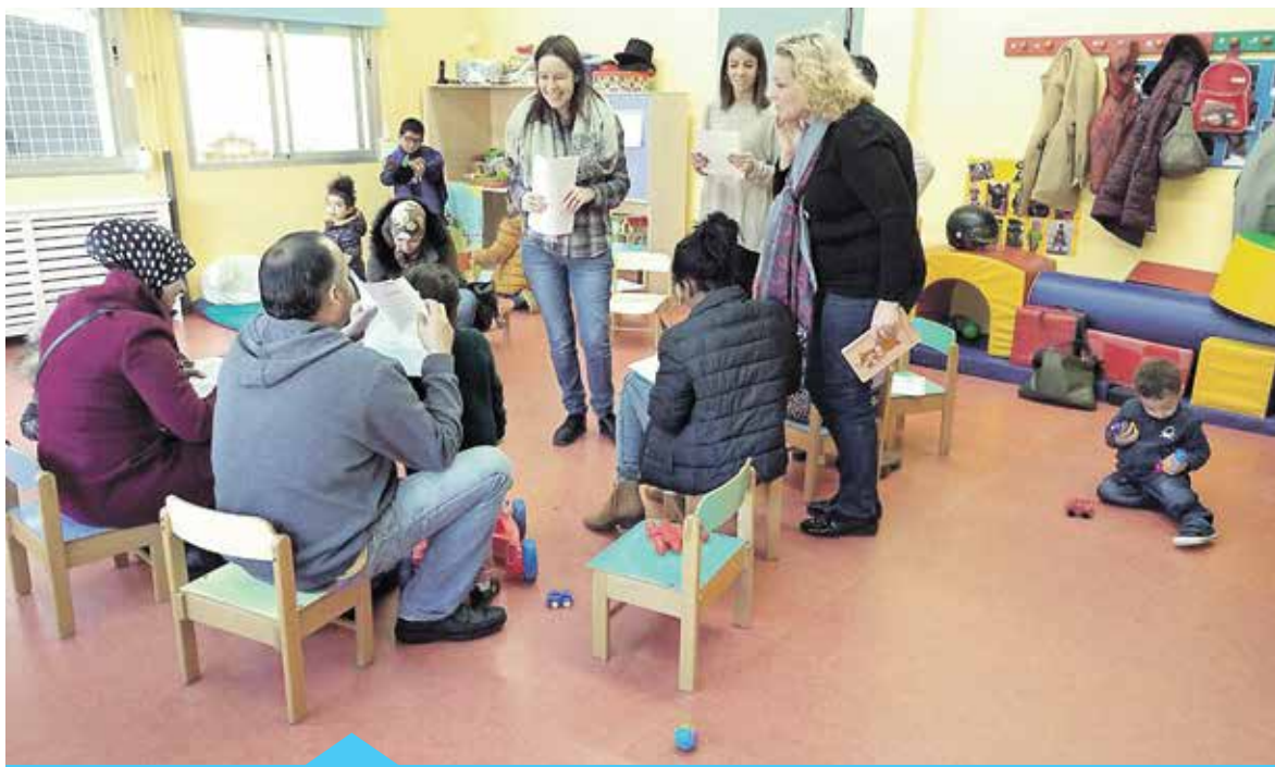
Els tallers són per a infants no escolaritzats

Aquest servei s'ha impulsat des del Servei d'Ensenyament i es fa en coordinació amb els Serveis Socials, que s'encarreguen de derivar-hi les famílies.