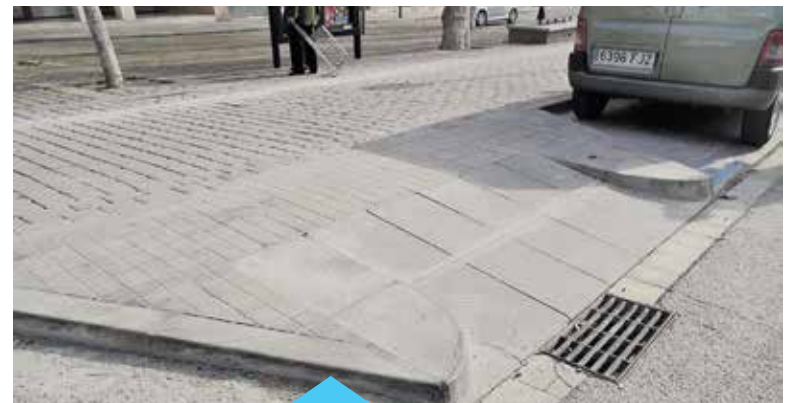
Es destinaran 400.000€ a arreglar voreres

Alhora, s'estan fent treballs de millora i naturalització a la plaça de l'Esperanto i a les places Salvador Moragas i dels Nens, noves àrees verdes. Pel que fa als treballs d'enjardinament de la plaça Salvador Moragas, ubicada a continuació de l'antiga Fàbrica del Gas, entre el carrer Joan XXIII i la Gran Via, ja estan força avançats i es preveu que finalitzaran al mes de maig. L'espai tindrà una zona verda que representarà els diferents hàbitats de la serralada de la Marina.