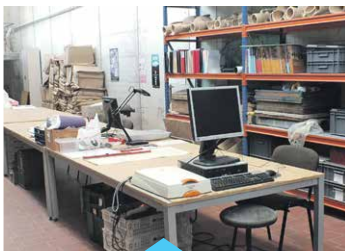
L'estudi permetrà conèixer millor com es vivia a la zona

L'estudi de totes les peces, que es poden datar majoritàriament entre els segles V i VII dC, hauria de permetre un millor coneixement de les formes de vida de l'antiguitat tardana a la zona de Premià, a més de proporcionar dades cronològiques de valor important.