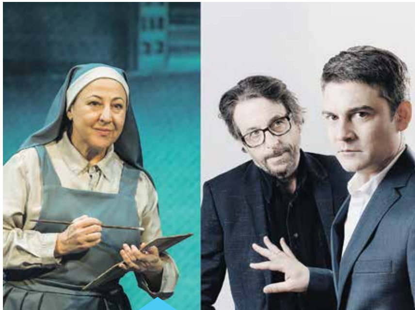
"La autora de las meninas" i "L'electe" es podran veure a l'Espai l'Amistat

L'Espai l'Amistat va obrir les seves portes el febrer del 2012 i des d'aleshores ha anat consolidant el seu públic progressivament fins a arribar a la xifra dels 42.540 espectadors. El gran nombre d'activitats que es realitzen i la diversitat en les disciplines artístiques que s'hi poden veure (teatre, dansa, música, cinema...) han convertit aquest espai en un referent per als premianencs i també per al públic de les poblacions veïnes.