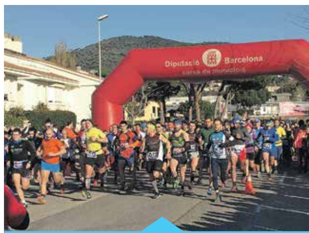
La cursa recapta fons per a un projecte solidari

Actualment 14 municipis de les províncies de Barcelona i Girona celebren l'IronKids. Aquesta dimensió fa que més de 6.000 infants d'entre 3 i 16 anys gaudeixin d'una gran festa esportiva en la qual la bona pràctica esportiva, la recompensa a l'esforç i la constància constitueixen els principals valors.