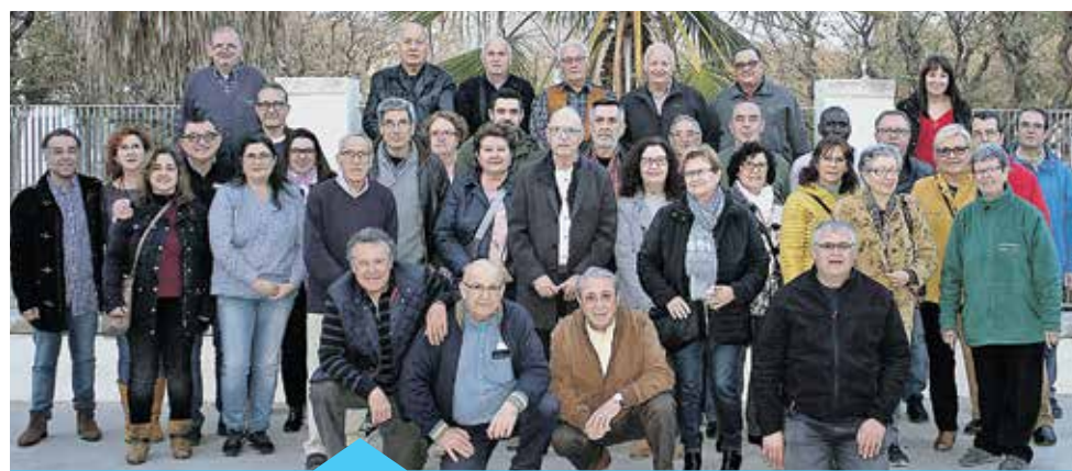
Col·laboradors i voluntaris del DISA

Exacte, la nostra ha de ser una tasca temporal. Cal intervenir en el sentit del mercat laboral i que les persones puguin desenvolupar un projecte vital treballant i tenint amics. L'objectiu és potenciar i acompanyar en la recerca de treball de