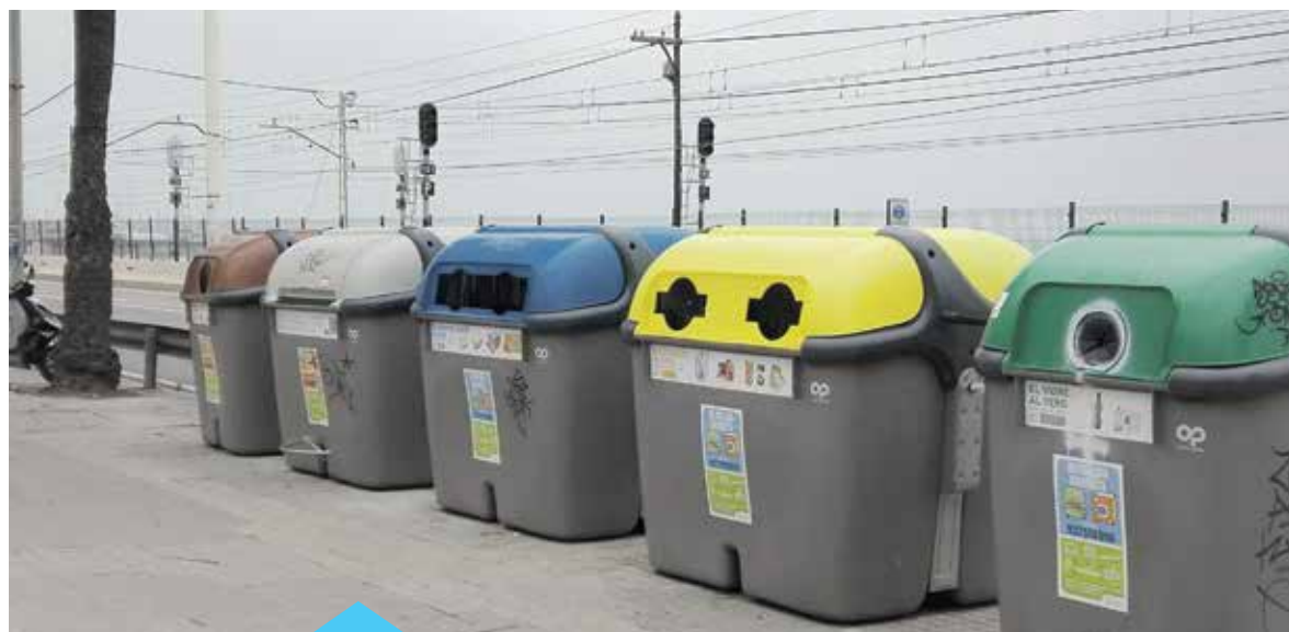
Els contenidors de l'N-II tenen més capacitat i permeten separar les 5 fraccions

ons diferenciades, fet que suposa una millora, ja que els soterrats només eren de rebuig i orgànica. D'aquesta manera, s'afavoreix el reciclatge i es redueixen els problemes de sorolls i olors, ja que els nous contenidors es troben a una major distància del veïnat. Alhora, cal destacar que els nous contenidors són de càrrega lateral, i això fa que es redueixi el temps de buidatge.