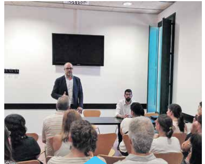
Benvinguda a treballadors incorporats a l'Ajuntament

Un total de 26 persones que es trobaven en situació d'atur es van incorporar a l'Ajuntament entre els mesos de desembre i febrer per fer diverses tasques com ara el suport a la recepció i obertura d'equipaments, suport a campanyes municipals o millora d'espais urbans. Aquestes persones formen part de diversos programes del Servei d'Ocupació de Catalunya: Treball i Formació, adreçat a persones en situació d'atur no perceptores de prestacions o subsidi per desocupació i preferentment més grans de 45 anys i a persones en situació d'atur beneficiàries de la renda mínima d'inserció; Treball als barris, destinat a persones aturades no ocupades; i Fem ocupació per a Joves, pensat per voler afavorir la inserció de joves entre 18 i 29 anys en situació d'atur i inscrits en el programa de Garantia Juvenil.