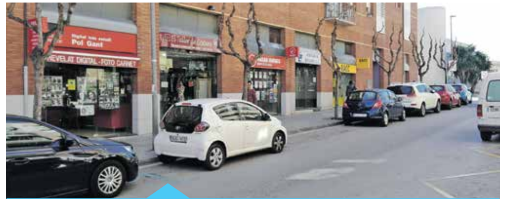
Segons l'estudi, el comerç urbà té un públic fidel

Amb aquesta nova organització es pretén que la policia s'involucri més en el dia a dia de la vila i el seu teixit associatiu i, d'aquesta manera, poder oferir un millor servei i donar resposta a les necessitats de la ciutadania.