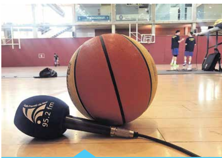
A les retransmissions en directe s'han afegit nous esports