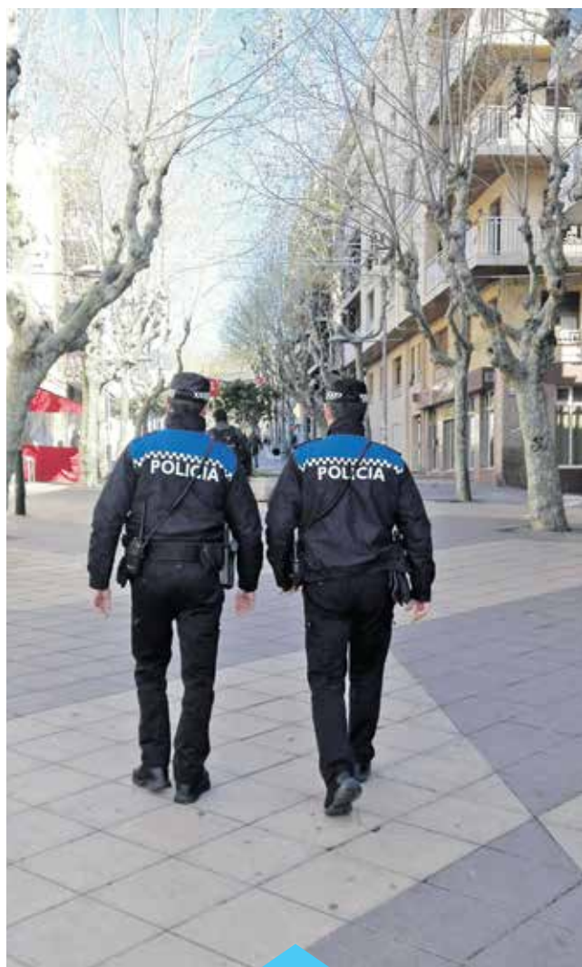
La policia local té una presència més activa al carrer

micilis disminueixen, i el delictes més denunciats és el de robatoris als interiors de vehicles. En aquest sentit, ja s'està treballant en la posada en marxa d'una nova campanya de cara a l'estiu amb més presència policial a les zones properes a les platges, tal com es va fer l'any passat.