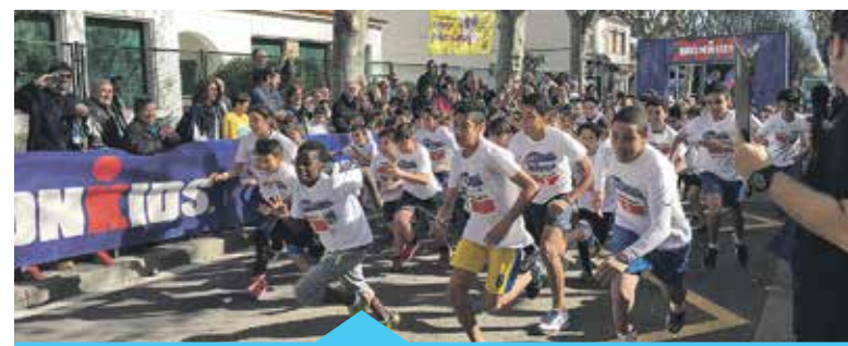
La cursa se celebra a diversos municipis