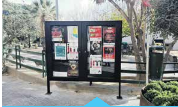
S'han instal·lat 13 cartelleres

Més enllà de millorar la difusió de les activitats de l'Ajuntament i les entitats, amb la instal·lació d'aquestes noves cartelleres també es pretén posar punt final a l'excés de cartells enganxats a les parets o altres emplaçaments incomplint les ordenances municipals que estableixen que no es poden enganxar cartells a façanes, columnes, arbres ni superfícies no autoritzades per l'Ajuntament. En aquest sentit, aquest 2017 es començaran a aplicar les sancions corresponents a aquells que no compleixin la normativa. Prèviament, s'informarà les entitats sobre quin és el procediment per penjar cartells i on es poden penjar.