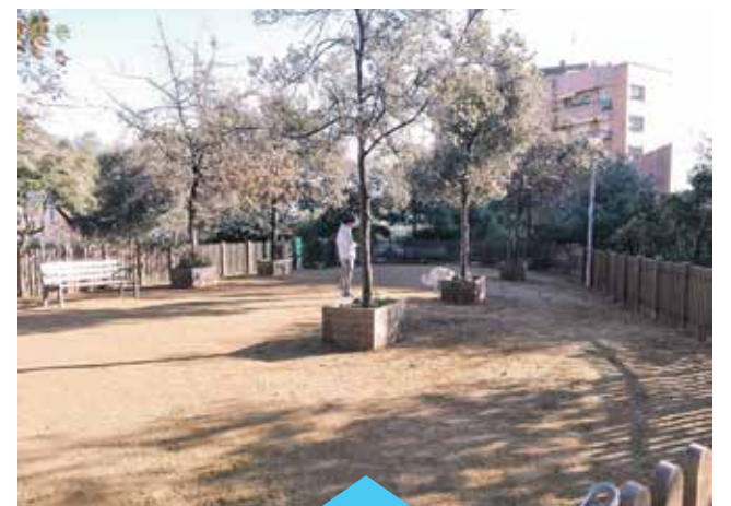
El nou espai per a gossos té 400 m 2

Aquesta zona per als gossos se suma a la que des de primers del 2016 hi ha al parc del Palmar.