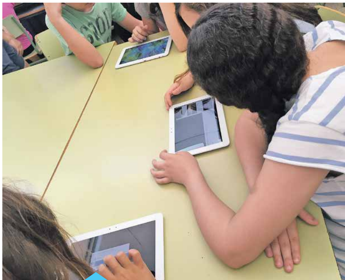
Noves tecnologies a l'abast de tots els alumnes

El cost dels dispositius que s'han cedit als centres educatius ascendeix a 21.359 € (IVA inclòs).