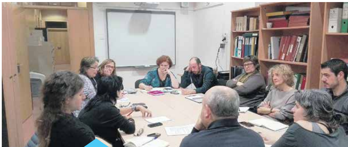
Reunió de la taula de gènere

Les properes accions previstes per la taula de gènere són l'elaboració d'un protocol centrat en la prevenció de les actituds sexistes, l'impuls de campanyes de sensibilització i un treball conjunt amb les escoles del municipi per portar a terme accions adreçades tant als alumnes com a les famílies.