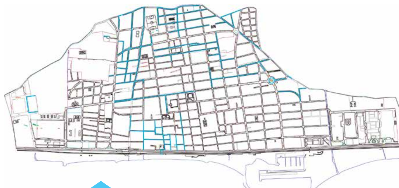
Carrers a on ja s'ha fet la renovació de l'enllumenat

led. L'actuació també contempla la substitució dels fanals més antics i obsolets i la instal·lació d'un sistema de telegestió. Tot plegat permetrà gaudir d'una xarxa d'enllumenat més eficient amb una reducció de la contaminació lumínica i una reducció del flux de llum en funció dels horaris, fet que permetrà un major estalvi energètic. En total s'actuarà sobre 2.828 punts de llum, un 83% de tots els que hi ha a Premià de Mar. El pressupost de la inversió és de 982.443 €, IVA inclòs.