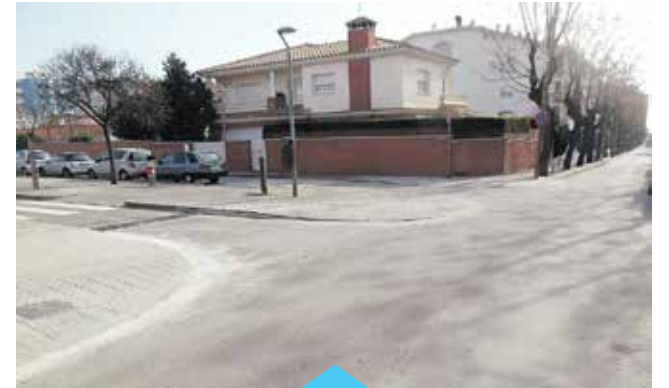
Hi ha un projecte per anar adaptant totes les voreres

Les obres formen part del projecte iniciat ja fa temps per anar adaptant les voreres de tot el municipi.