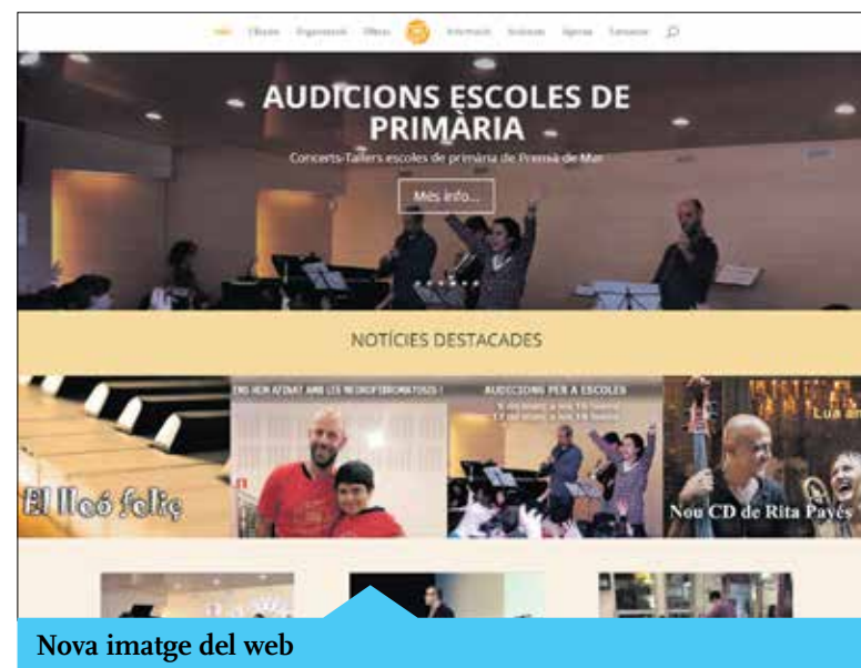
Nova imatge del web

https://www.facebook.com/emusicapremia/ també es pot seguir tota l'actualitat del centre.