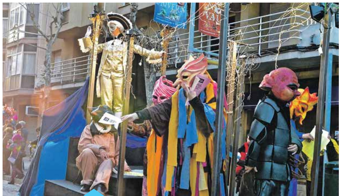
Els Penjaculpes tornaran a fer acte de presència a la Festa Major d'Hivern

“Animo a todos los premianenses a disfrutar del carnaval y la fiesta mayor de invierno, que disfruten de todos los actos organizados con el máximo respeto y armonía entre todos”.