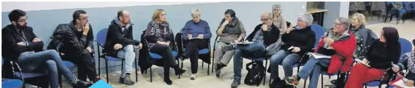
El consell de cultura es va reunir al mes de gener

es debatran dins el Consell de Cultura, format per tècnics de l'Ajuntament, grups municipals, entitats o associacions culturals i persones a títol individual. Serà aquest mateix òrgan el qual, per mitjà d'una votació que es farà el dia 7 de març, escollirà quina o quines propostes de les proposades es portaran a terme durant aquest 2017.