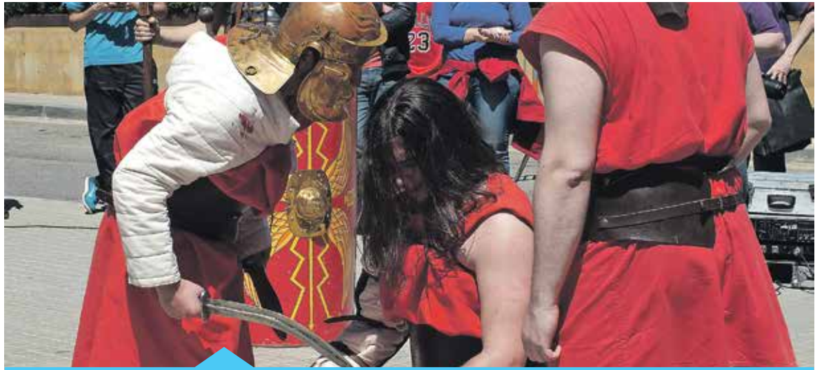
La festa comptarà amb activitats i tallers sobre el món romà

El Museu Romà està preparant la III festa romana per commemorar el segon aniversari de la seva obertura al públic. Durant aquests 2 primers anys han visitat el jaciment gairebé 4.000 persones, entre els quals hi ha escolars de diverses poblacions de la comarca. Pròximament està previst que les escoles que ho vulguin facin la visita en anglès, de manera que els alumnes puguin gaudir d'una experiència doblement enriquidora. La festa romana es farà durant tot el matí del diumenge dia 19 de març i comptarà amb diversos tallers i activitats relacionats amb el món romà.