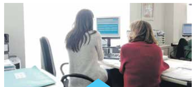
La formació es fa a la mateixa empresa

Tot i que l'Ajuntament ja ofereix directament a les empreses aquest servei, qualsevol empresa que hi estigui interessada pot demanar assistència través de l'adreça següent: serveiseconomic@premiademar.cat .