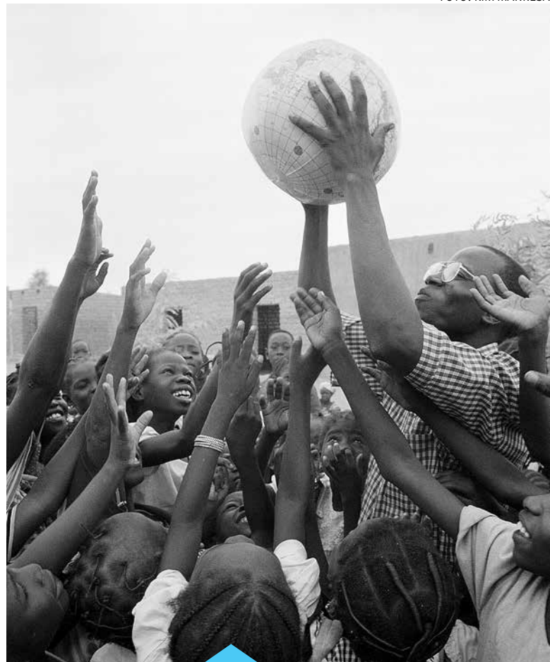
Imatge que es pot veure a l'exposició