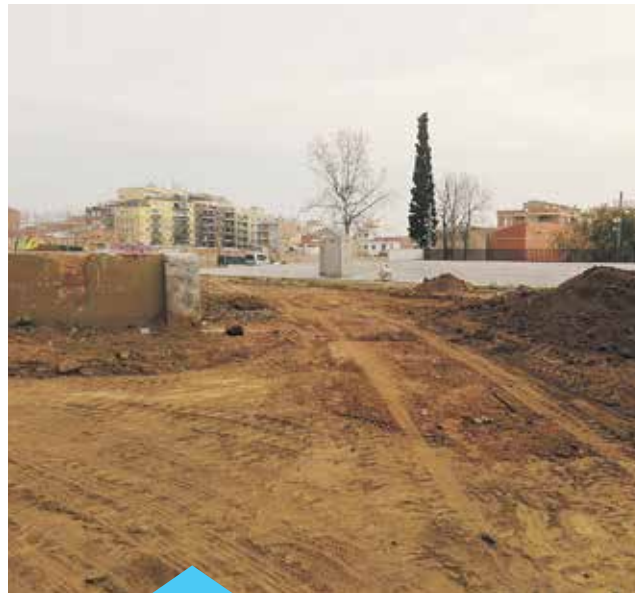
Els treballs finalitzaran a la primavera

D'altra banda també hi haurà bancs de fusta sostenible, una font i una petita bassa amb plantes aquàtiques. Finalment, es posaran nius als arbres per fomentar la proliferació d'aus autòctones.