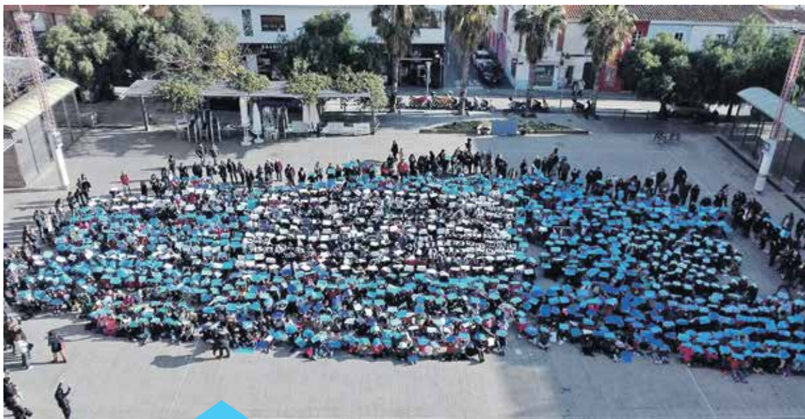
Els participants van fer un mosaic

L'objectiu d'aquesta jornada era fomentar la cohesió social entre els alumnes de Premià de Mar i crear un compromís amb els principis de llibertat, justícia, solidaritat i tolerància.