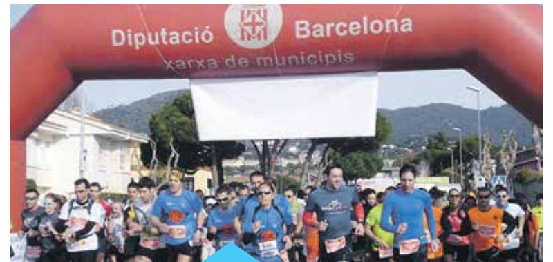
Hi haurà dues curses de 21 i 12 km

cas, es tracta d'infants que han fugit de casa seva a causa de la guerra i en molts casos fa mesos o fins i tot anys que estan sense escolaritzar. Quant als infants libanesos, es tracta de nens i nenes en situació precària que, tot i estar escolaritzats, necessiten també un reforç escolar per poder seguir el curs amb normalitat. Les inscripcions es poden realitzar per Internet a l'adreça marinatrail.cat .