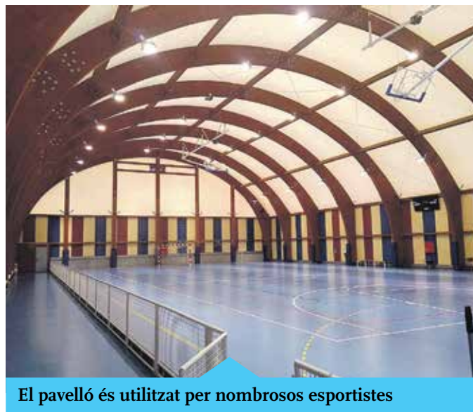
El pavelló és utilitzat per nombrosos esportistes

Durant el primer trimestre d'aquest 2017 està previst que finalitzi la construcció d'un nou vestidor al pavelló Voramar. Els treballs van començar a finals de l'any passat i en una primera fase es van fer els treballs de paleta, fusteria i pintura. Les properes setmanes es preveu que començarà la segona fase, en la qual es faran els treballs d'instal·lació de dutxes, sanitaris, accessoris i la instal·lació elèctrica. Actualment les instal·lacions del pavelló són utilitzades per quatre entitats esportives i una escola, a més dels partits que s'hi juguen els caps de setmana. El pressupost total de l'actuació és de 23.900 €.