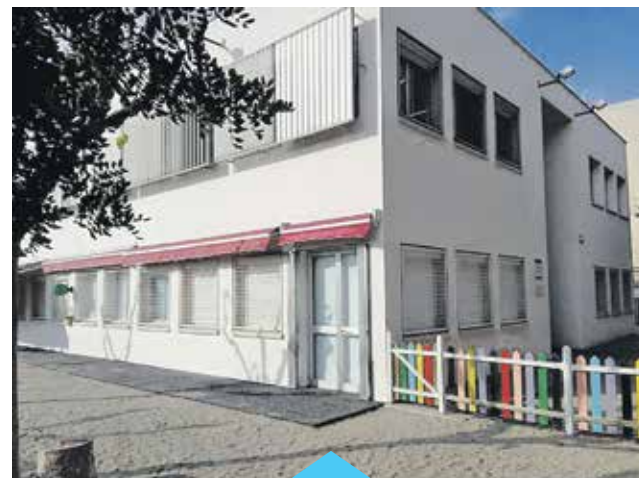
La façana de l'Escola Bressol es va pintar

També es van fer treballs de manteniment de l'arbrat dels recintes escolars.