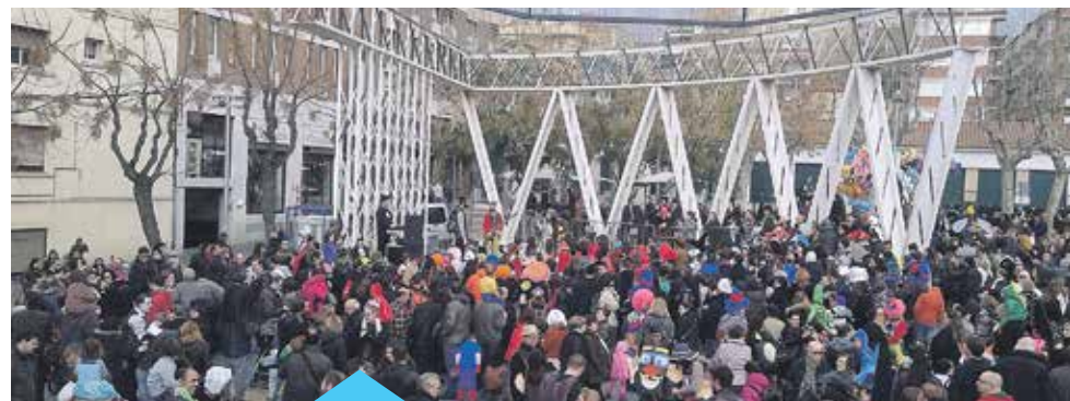
La setmana s'omplirà d'activitats de Carnaval

Dimecres de Cendra, com el seu nom indica, en Primilià és cremat a la plaça. Abans, però, els Penjaculpes llegiran el testament que ens ha deixat el rei, i les ploraneres en ploraran l'absència, mentre els nens i grans que ho vulguin, podran tirar la sardina que portin a la foguera. La Vella Quaresma apareixerà aleshores per calar foc a la pira.