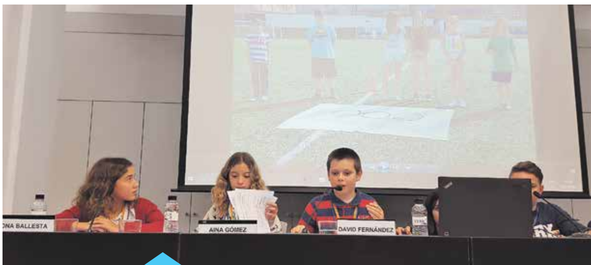
Moment de la intervenció dels alumnes premianencs

participar en la taula de debat: "Experiències dels consells d'infants i adolescents" i a fer la cloenda de l'acte. Els representants premianencs van ser els encarregats d'explicar l'organització del Consell, així com les accions que s'han treballat des d'aquest òrgan de participació format per l'alumnat de 5è i 6è de primària.