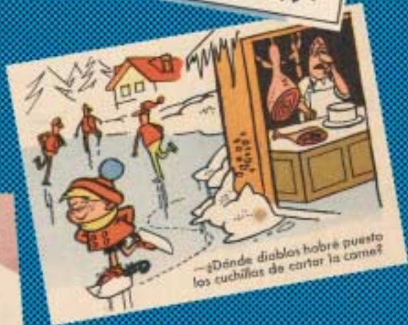
—¿Dónde diablos habré puesto los cuchillos de cortar la carne?