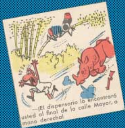
—El dispensario lo encontrará usted al final de la calle Mayor, a mano derecha!