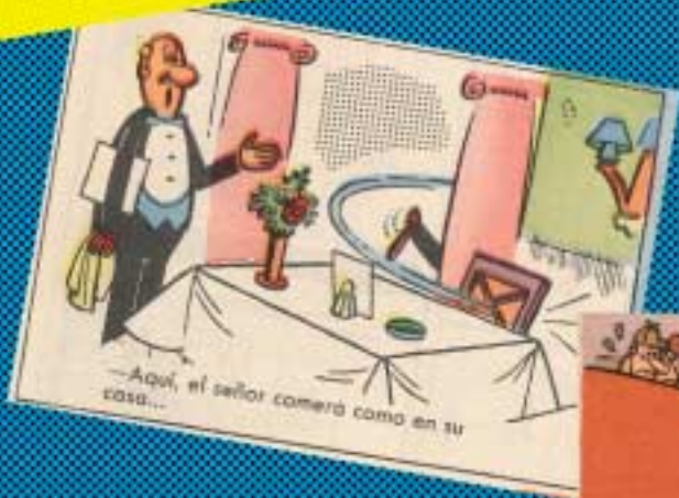
—Aquí, el señor comerá como en su casa...