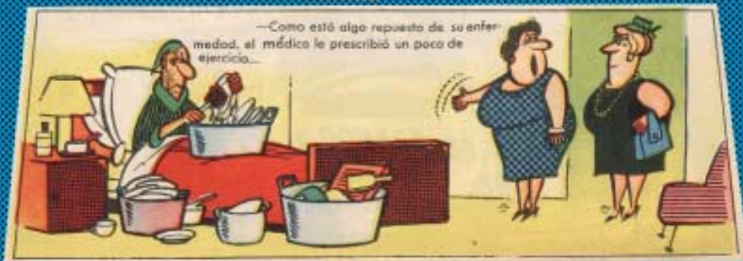
—Como está algo repuesto de su enfermedad, el médico le prescribió un poco de ejercicio...