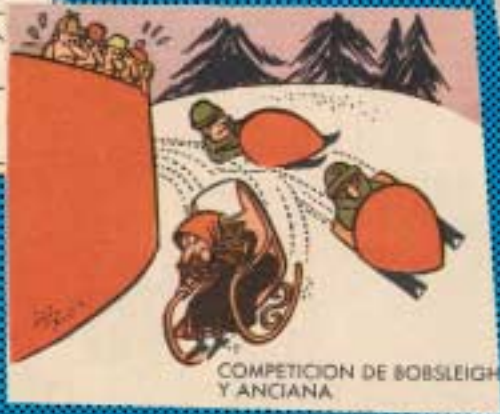
COMPETICION DE BOBSLEIGH Y ANCIANA