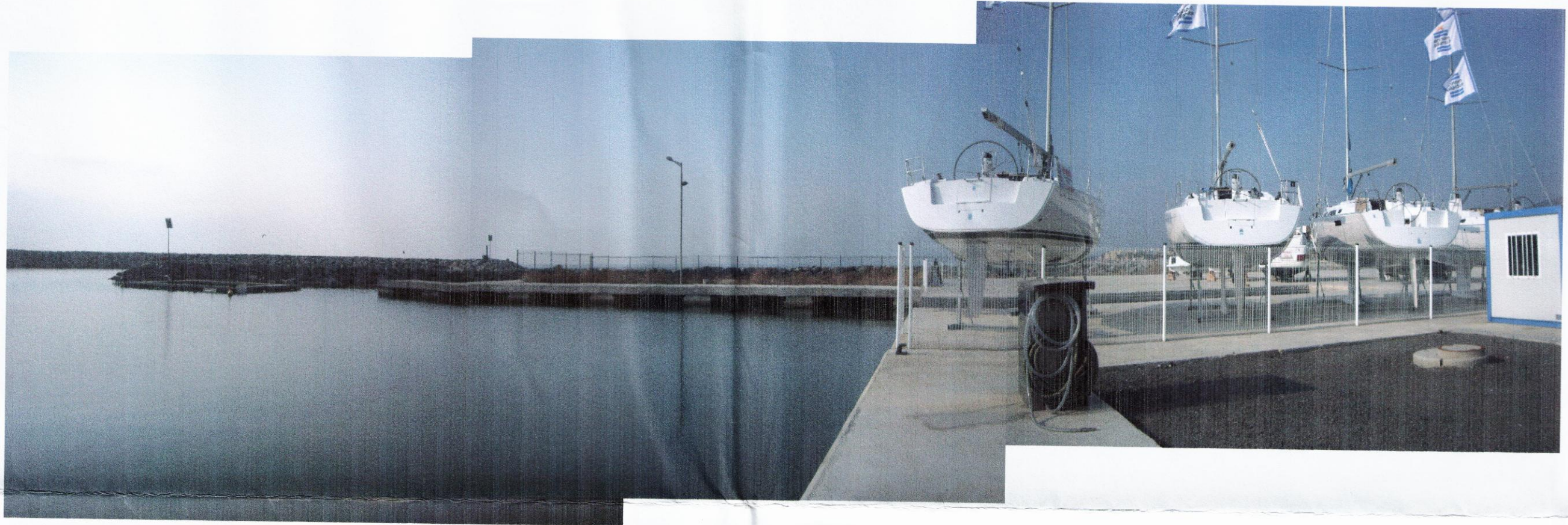
CONTRADIC I ÀREA TÈCNICA