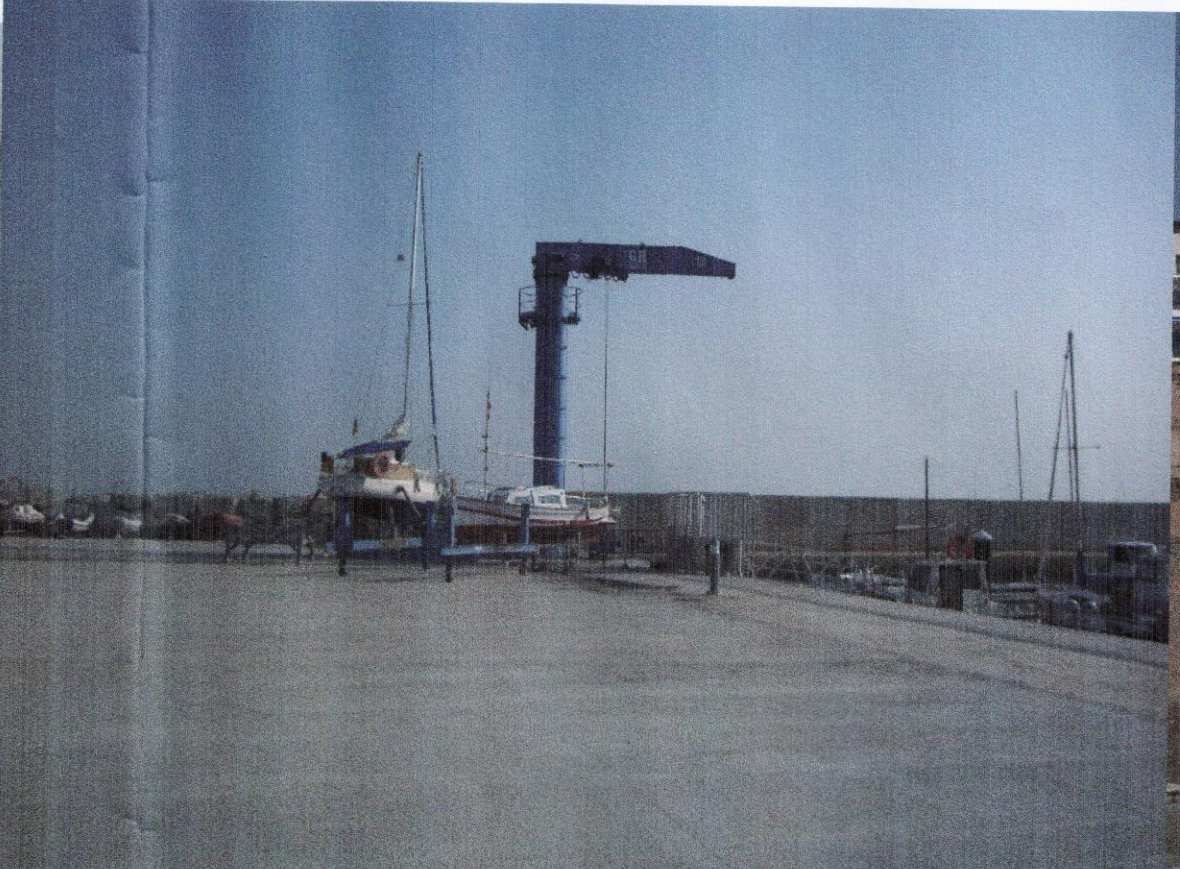
GRUA I ÀREA DE VARADA DE VELA LLEUGERA