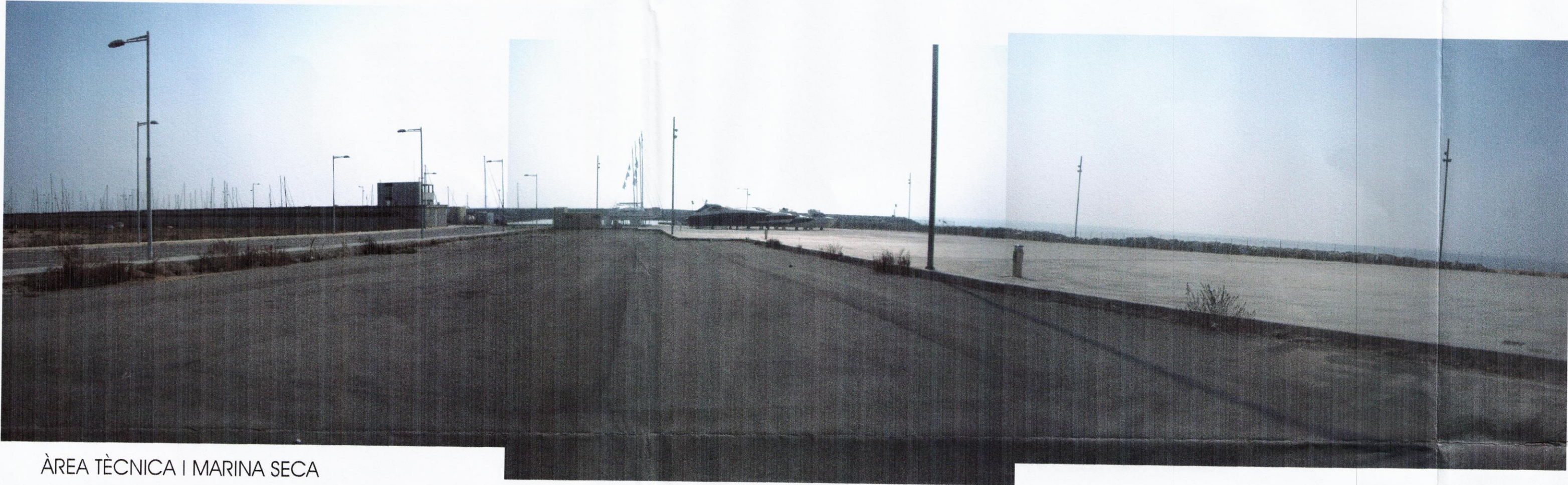
ÀREA TÈCNICA I MARINA SECA