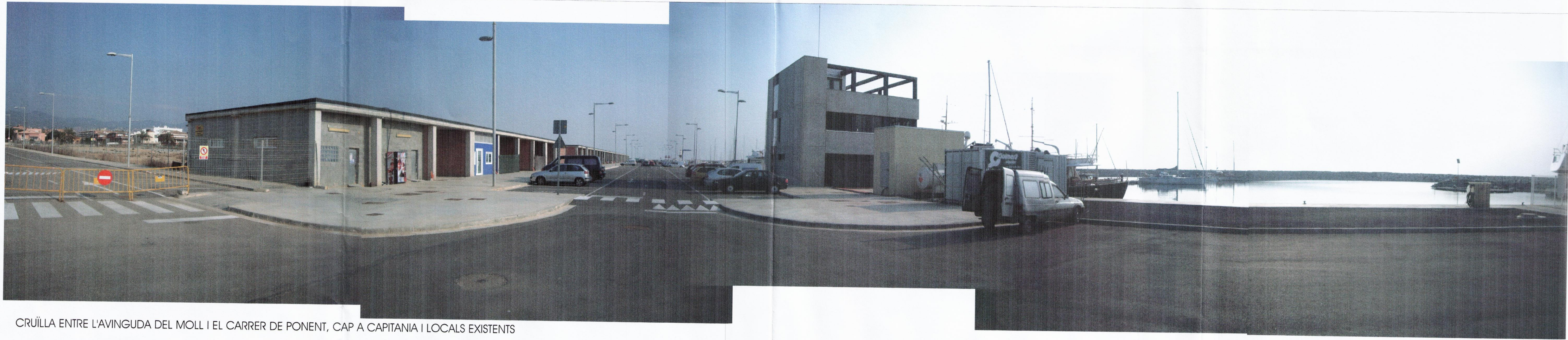
CRUÏLLA ENTRE L'AVINGUDA DEL MOLL I EL CARRER DE PONENT, CAP A CAPITANIA I LOCALS EXISTENTS