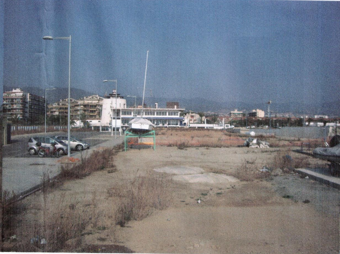
VISAT DEL CARRER DE LLEVANT I CLUB NÀUTIC ACTUAL