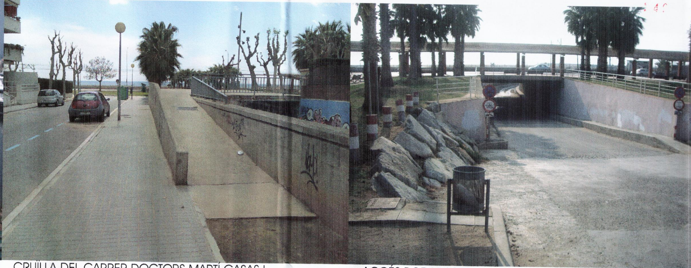
CRUÏLLA DEL CARRER DOCTORS MARTÍ CASAS I CARRER DE LA TERRA ALTA, AMB EL TORRENT DE CA L'AMELL