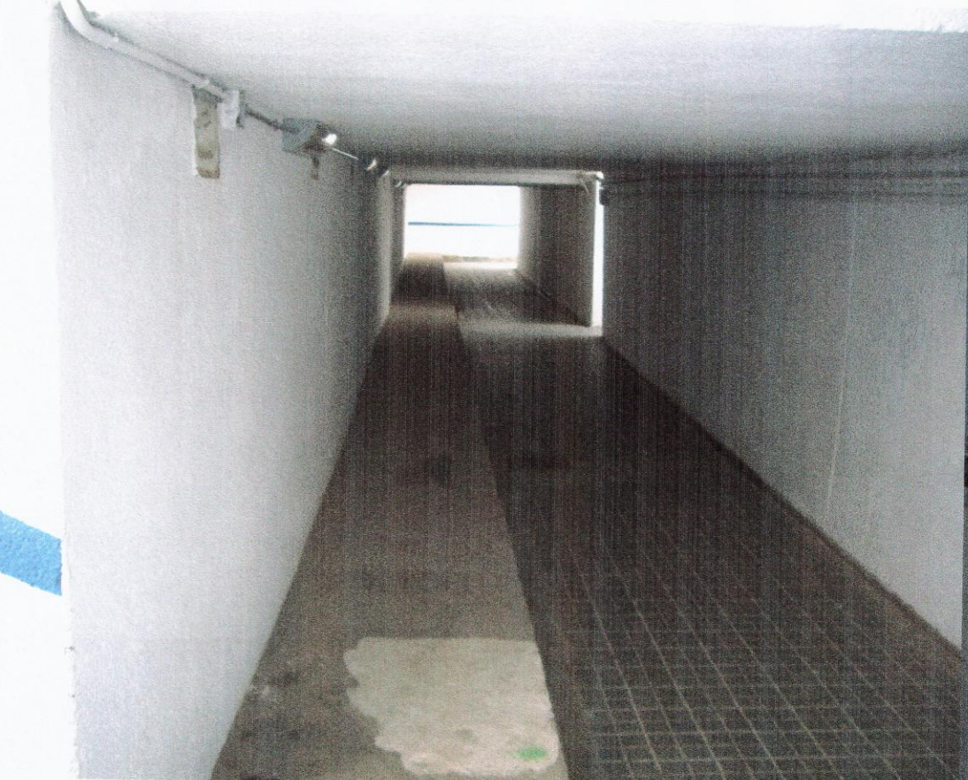
PAS PEATONAL SOTERRAT A ANTIC ABAIXADOR DE RENFE