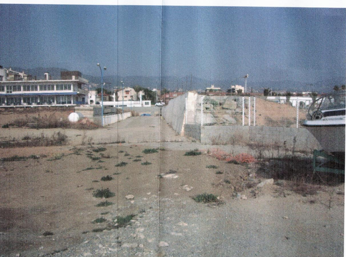
MUR DE CONTENCIÓ A LA ZONA DE LLEVANT DEL PORT