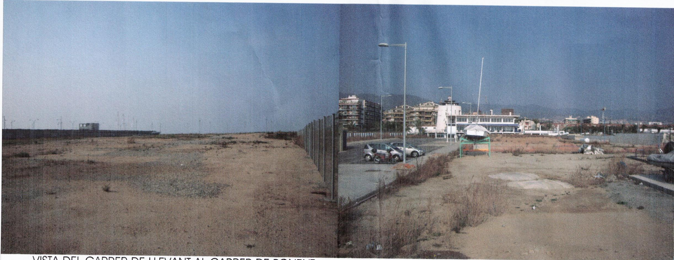
VISTA DEL CARRER DE LLEVANT AL CARRER DE PONENT (PART POSTERIOR DELS LOCALS EXISTENTS)