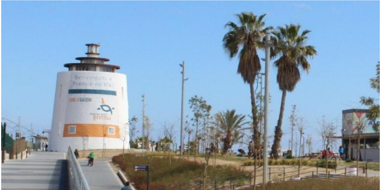
Imatge 2. Exteriors de la Torrassa del port.

L'Ajuntament disposa de titularitat directa sobre la Torrassa. Les propostes que projectin actuacions sobre l'entorn immediat hauran de formular-se amb caràcter conceptual i restaran condicionades a les verificacions i autoritzacions que eventualment siguin necessàries.